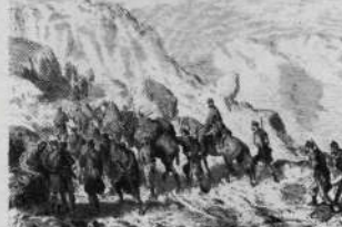
Recorridos de montaña - La ruta sangrienta