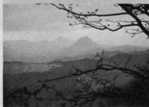
Travesía insólita a través de Navarra Guipúzcoa y Alava.