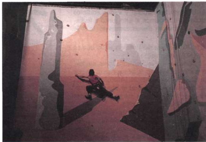
Centro de danza «El Patio».

Parece que se va animando el tema de construcción de rocódromos. Así la Sdad. Anaitasuna de Iruña ha construido uno en sus instalaciones de Trav. Monasterio de Irache. También el Centro de Danza «El Patio» de Gasteiz (Domingo Beltrán, 26) cuenta con otro. Sabemos que en Azkoitia se va a construir otro. Esperemos que otros Ayuntamientos se animen.