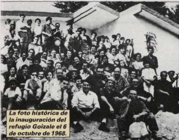
La foto histórica de la inauguración del refugio Goizale el 6 de octubre de 1968.