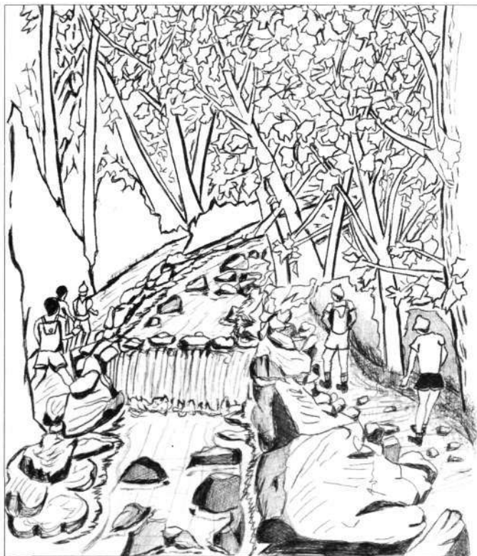
Una interpretación naïf de la entrada al barranco Marin, en versión del aítona.

Nuestro avance es lento porque disfrutamos en ese paraje que el neófito se atreve a