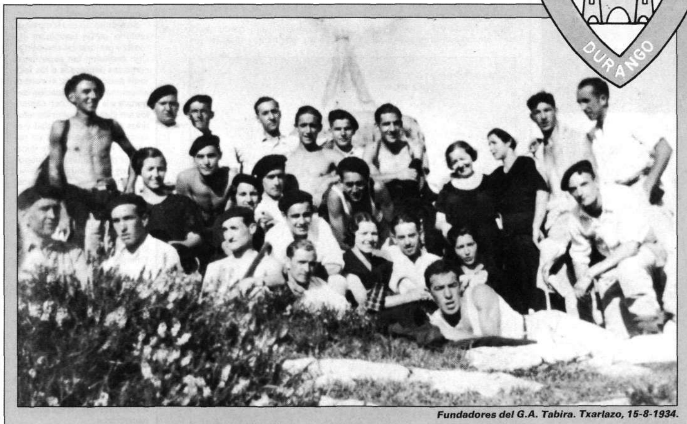
Fundadores del G.A. Tabira. Txarlazo, 15-8-1934.