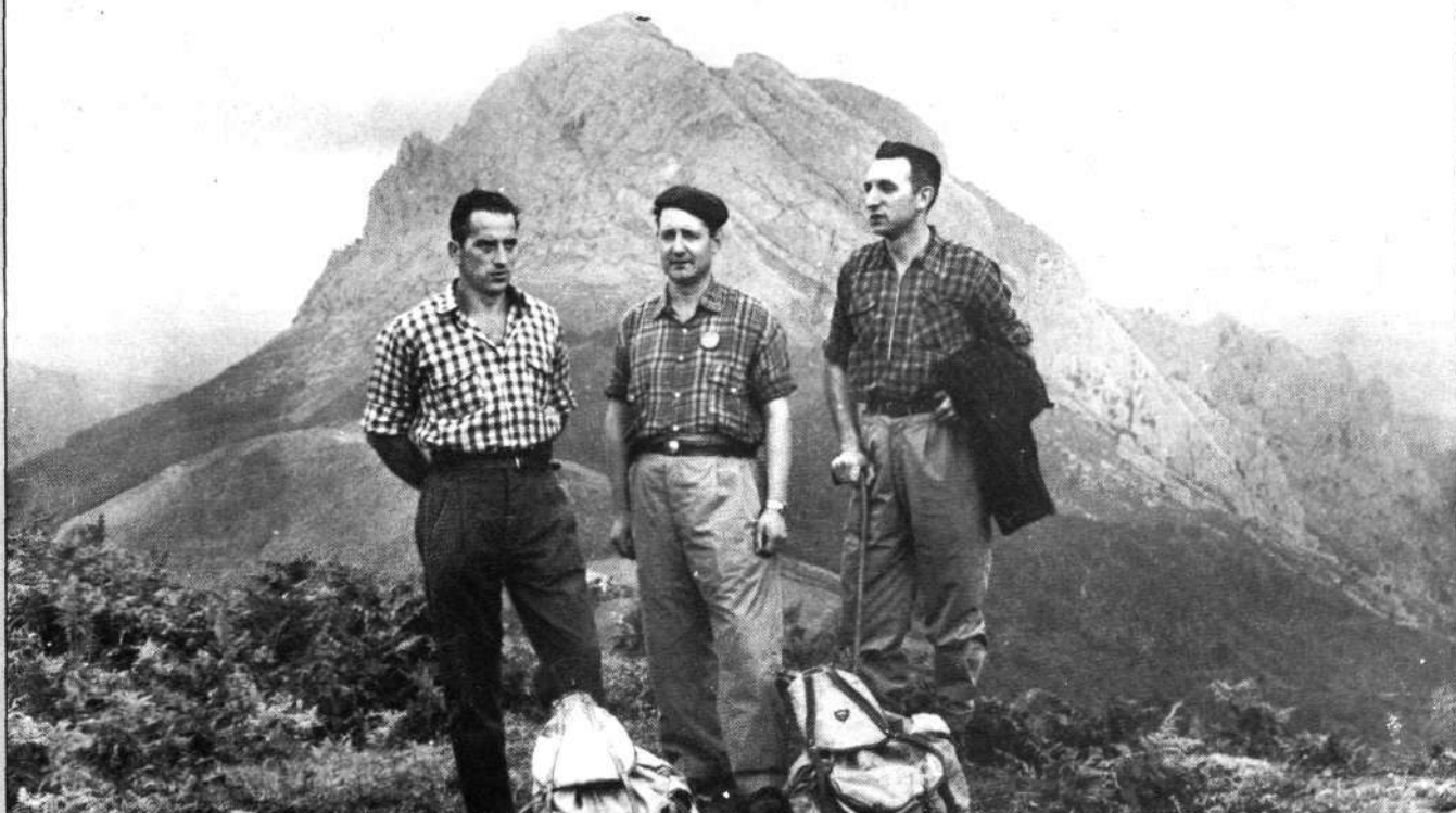
Reconstituidores del G.A. Tabira. Durango, 18-10-1943.