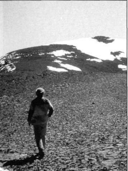
M'goun. Hacia la cima.

que se hiciera de noche, y si era posible, alcanzar la primera aldea del Assif -n- lmeskar para preguntar a alguien dónde nos encontrábamos. Una cosa estaba clara, fuésemos por donde fuésemos, no volveríamos a cruzar las montañas del Assel-da para regresar a Ait Toumert.