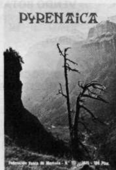
n.º 117 100 ptas. Aguja de Chardonet Pico Central de la Meije Pico Lezna Avalanchas de nieve