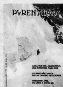
n.º 129 160 ptas. Cara Sur Aconcagua En la muga Serre da Estrela Macizo Mont Blanc

Si te interesan llámanos al tfno. (94) 444 55 45 (de 18 a 21 h.)