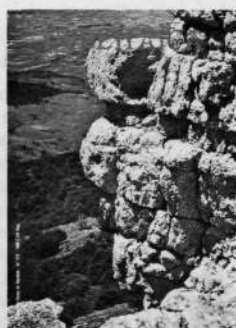
n.º 119 125 ptas. Escuela de escalada de Egiño Montañas de Noruega Cara N. del Cervino Travesías esquí en Córcega Macizo de Arbaillies