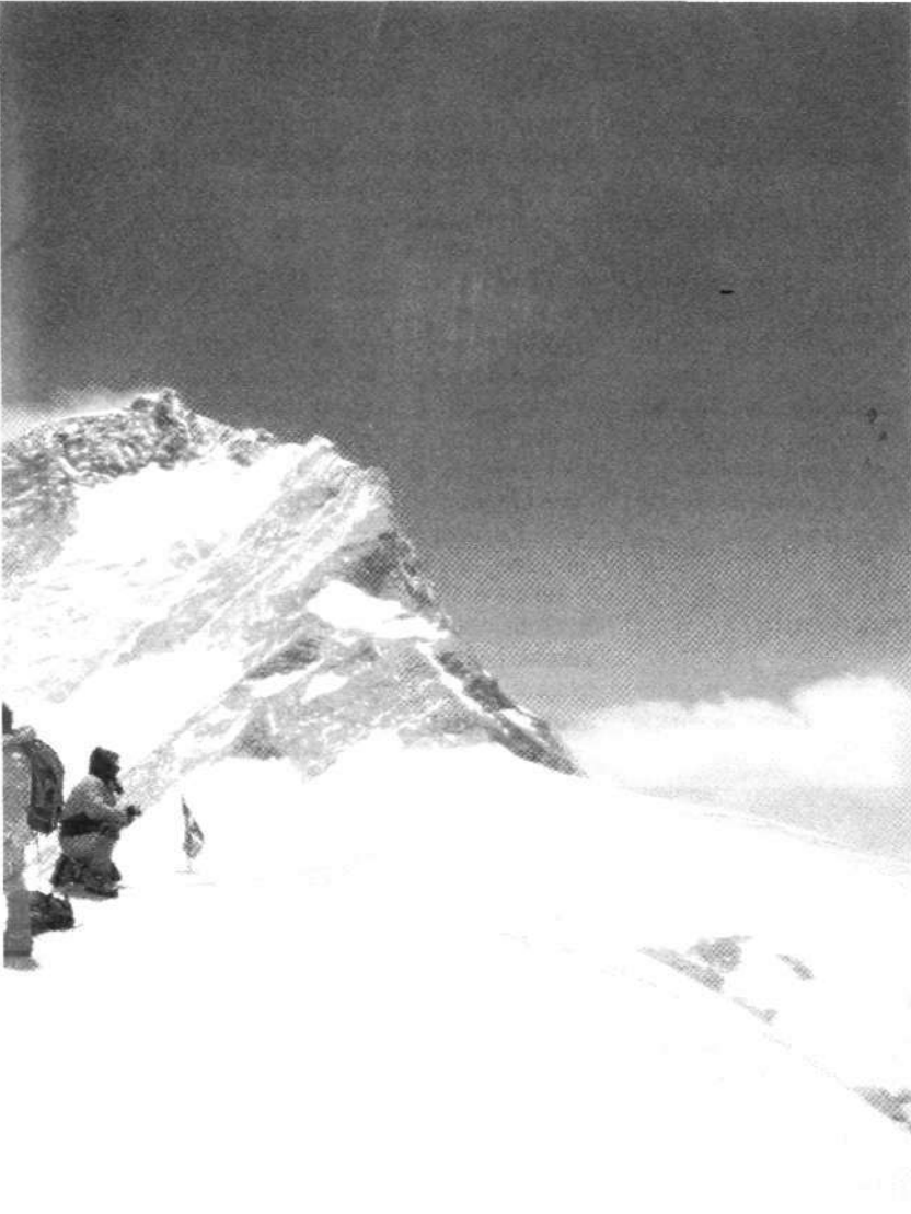
Cima Kangchuntse (7.640 m.).