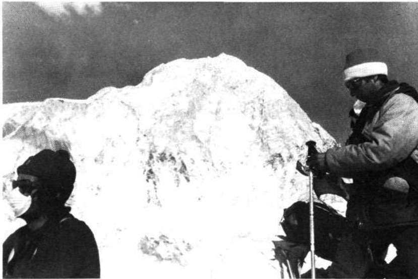
Al fondo el Makalu, en la cima del Chago (6.170 m.).

Pozik nago glaziare, seracs eta arraildurak atzean uzteaz, egun osoa nere ski bastoaz paseatzen, piolet eta bota bikoitzen beharrik gabe, eta buruan oraindik azken asteetako burutapen berbera. Leku honek Nee du izena, zoragarria da, Nepalen ikusi dudan politena, egunen batetan itzuliko naiz, lauretan jeiki, zerua oskarbi, mendien edertasuna bera ere ikusten hasten da eta etenik gabeko ur hotsa, Makaluko haize gogorraren ordainez. Hau da bizia hau! Bekokian daramadan argia bukatzen ari zait, gero arte.»