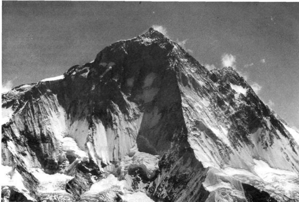
Makalu (Pilar Oeste).