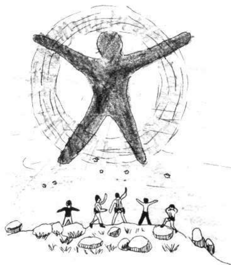
Efecto de Broken (Alluitz).