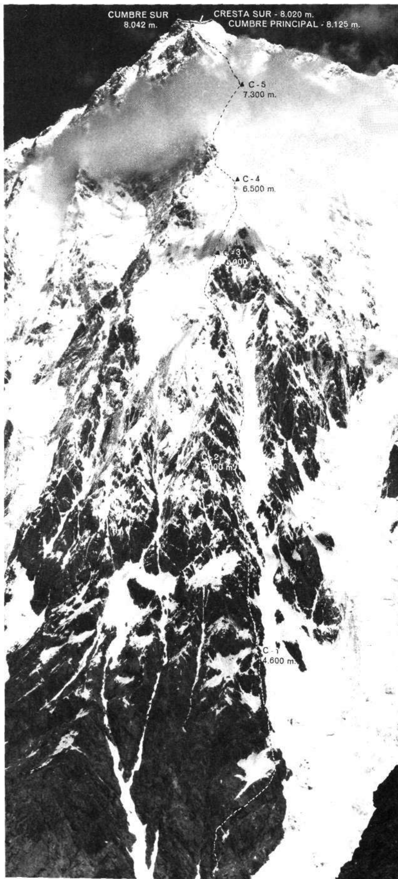
Nanga Parbat, pilar Este.

un ascenso por la pared Sur Rakhiot hasta el Rakhiot Peak y desde allí, siguiendo por la ruta Merkl, hasta la cumbre. Por esta última vía ascendimos en 1975 hasta una altitud de 6.800 metros.