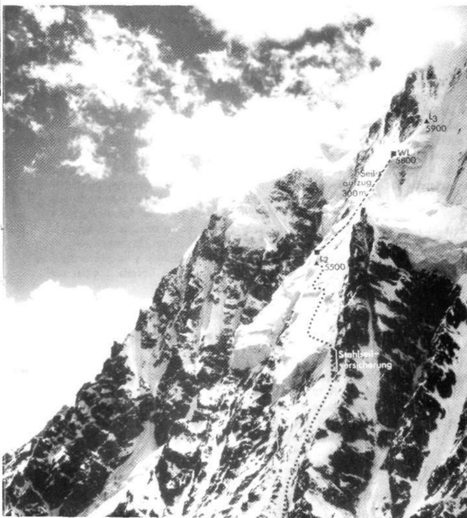
Ladera 'Rupal' del Nanga Parbat (8.125 m.), vista desde el Este. La foto muestra la ruta de ascenso de las expediciones de 1964, 1968 y 1970 bajo la dirección de Herrligkoffer.

Cuando llegaron allí, se encontraron con la agradable sorpresa de la presencia de Münchenbach y Bühler, como un auténtico refuerzo para el día siguiente. Les habían traído cuerdas y algo de alimentación, de manera que pudieron asegurar presas en las paredes de hielo del tercer nevero para el posterior descenso. A la mañana siguiente fueron cuatro los hombres que subieron, a poca distancia el uno