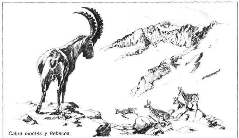
Cabra montés y Rebecos.