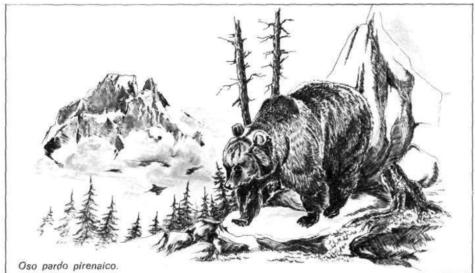
Oso pardo pirenaico.