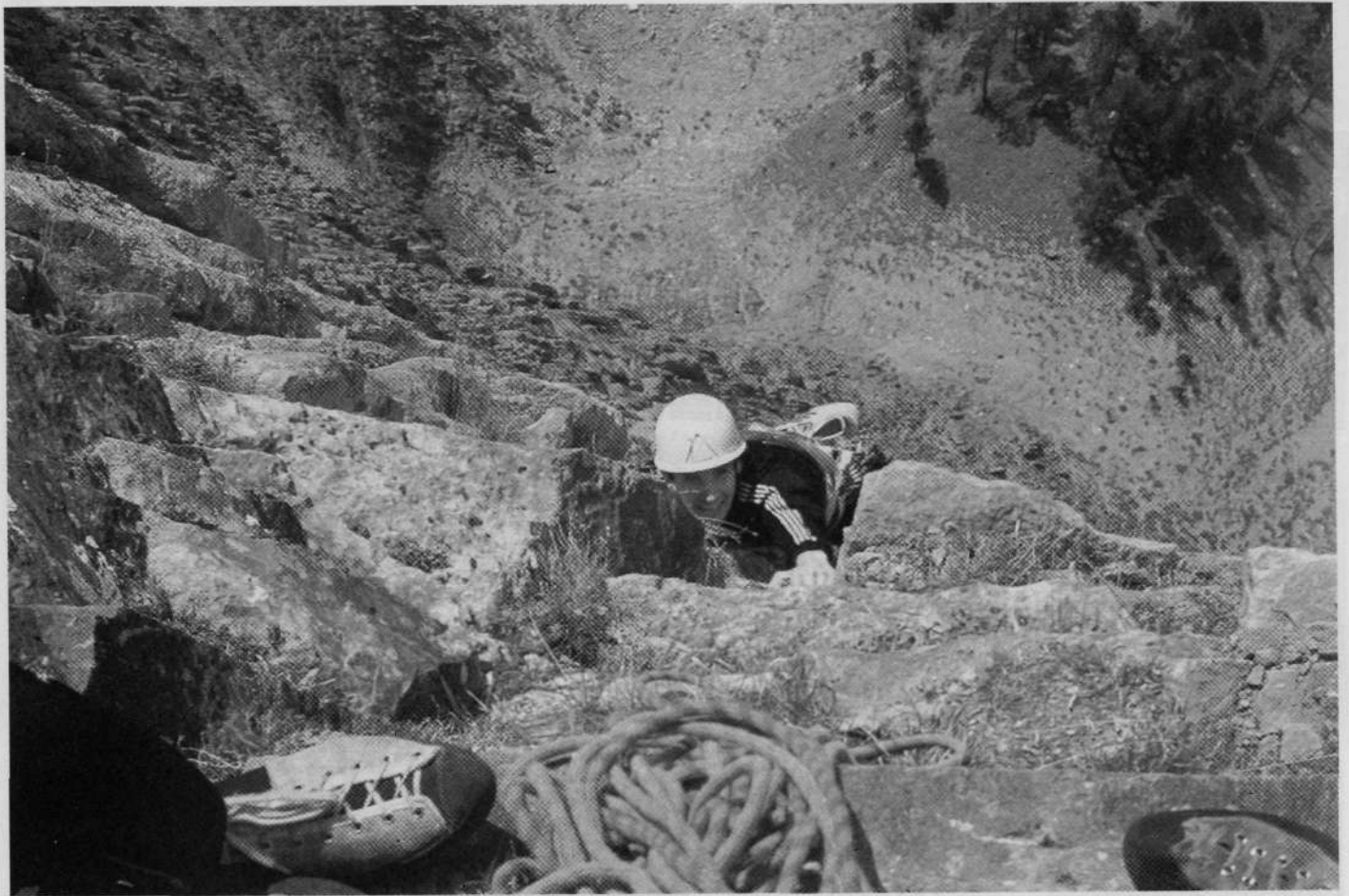
Atsedean bat eginaz, Gallineroaren Espoloiari begira.