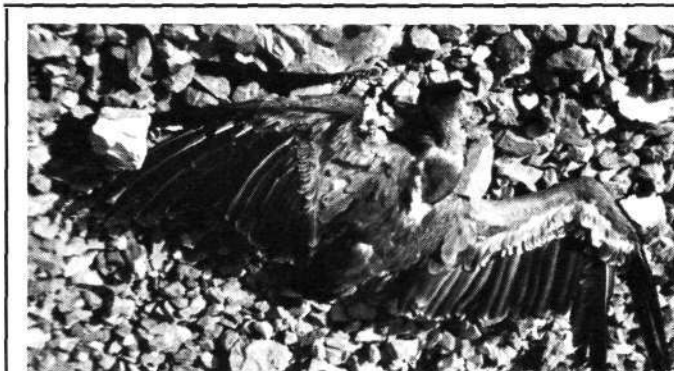
Uno de los cuatro buitres muertos a tiros en Mugarra. ¿Por qué? ¿Para qué? ¿Quién lo hizo?

Investigadores españoles, franceses, italianos, alemanes y suizos han presentado más de 35 comunicaciones sobre el tema: la biología, la ecología, la antropología de los grandes animales salvajes; inserción de las biocecosis y diversos sistemas socio-económicos.