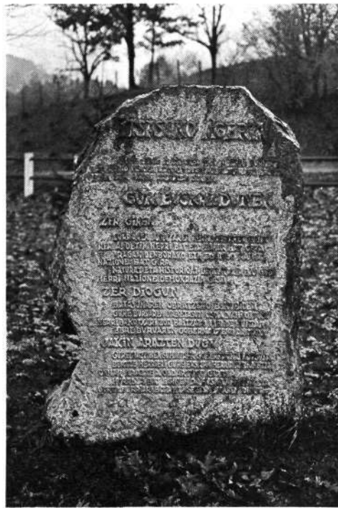
Estela en el parque «Elizalde de Itsasu». La estela representa «La llamada de Itsasu» (Itsasu-ko Ageria) referente a los vascos y la misma ha sido grabada en el monolito en letras de molde con tres apartados: «Zer garen»; «Zer diogun»; «Zer arazten dugun».

Cimas de Urresti, en primer plano, y Mondarrain, detrás. «De repente recibimos un ramalazo de aire y la zona costera se despeja en segundos. Las nubes se elevan descubriendo todas las cimas de las montañas.»