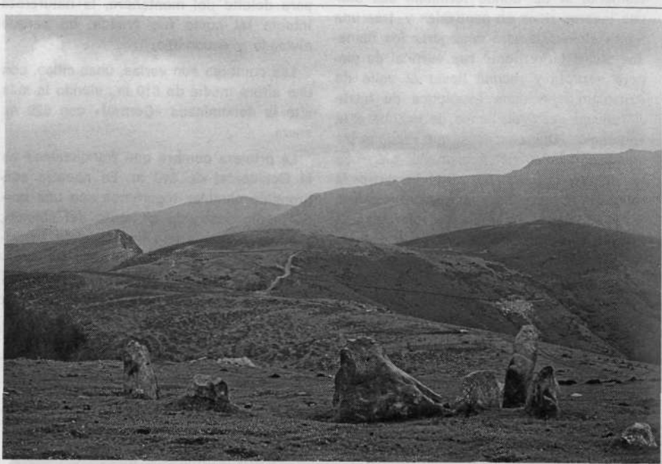
«Al fin el tan famoso y divulgado cromlech de Mehatse compuesto por siete grandes piedras y es inconfundible. Debemos detenernos para observarlo bien y pensar en la historia que queda archivada en este círculo.»

La ascensión al Iguzki se realiza salvando un inclinado repecho herboso en 15 ó 20 minutos. La vista es excelente, en especial sobre Artzamendi al NE, sobre los altos de Itxusi al Este, y sobre el circo de Irubela, Iparla y Gorramendi al SSE. Am-