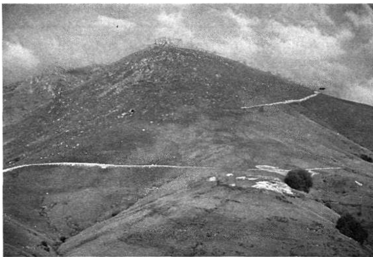
«El Iguzkimendi (844 m.) es un pico herboso, puntiagudo, que está unido al más alto, el Artzamendi, por el collado Mehatse. La cima del