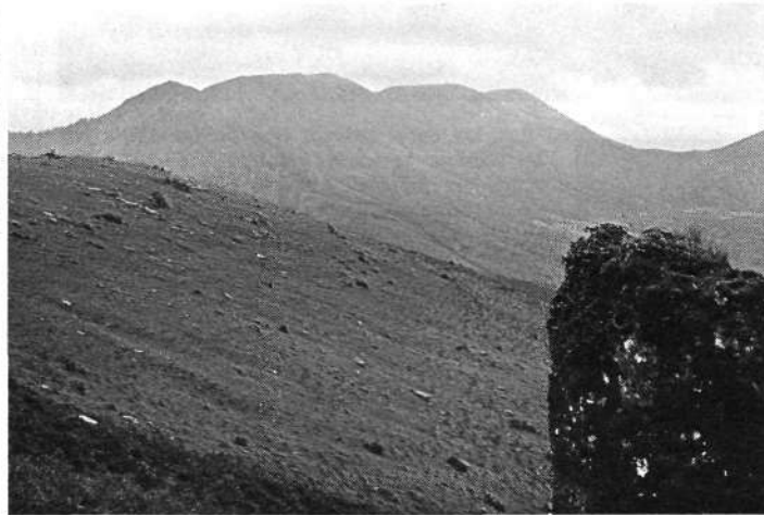
«Son las once y cuarto a 710 mts. de altura y nos encontramos rodeando el Iguzki. Protegidos tras una alta roca, observamos extensamente todo el macizo del Gorramendi.»

más de cien estelas discoidales. Su interior es una maravilla, su retablo, las tres tribunas, sus cuadros, uno de ellos atribuido a Murillo, forman un conjunto realmente admirable, obra de diversas generaciones.