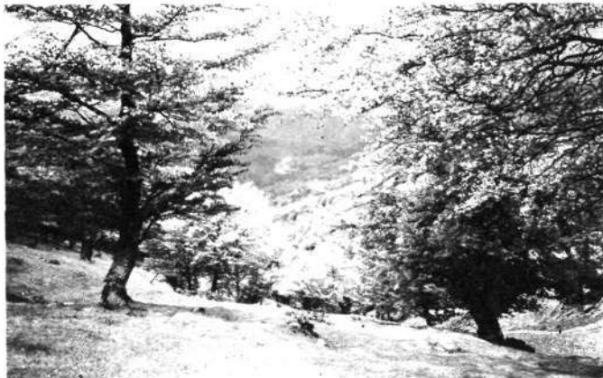
El collado de Elola, que da entrada a la campa de URBIA en la sierra de AITZGORRI. En el centro, en el hueco entre las ramas de las hayas se destaca el santuario de ARANTZAZU. (Foto Manu Uriarte).

En este sentido, hay que destacar que a la destrucción total del yacimiento de Saillleunka se suma la parcial de Azkondo y Bolinkoba, así como la desaparición de diversos dólmenes esparcidos por toda la geografía vizcaína. Dentro de ésta, la zona más castigada desde el punto de vista arqueológico es la de