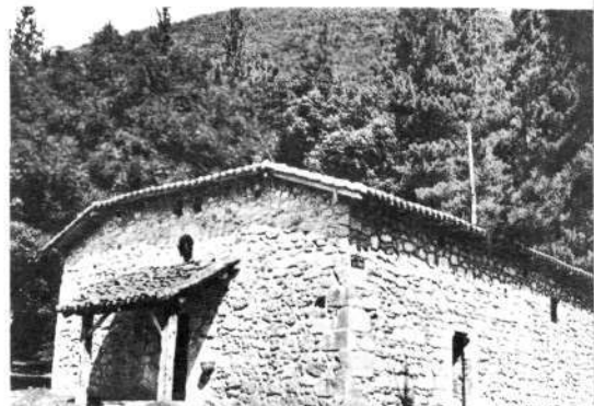
Figura 2: Ermita de Santimamiñe (Kortezubi).

En cuanto al fragmento n.º 3 suponemos que corrió la misma suerte que sus compañeros, aunque como se ve pertenece a tipos ya de sobra conocidos en el País Vasco.