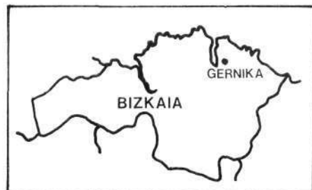
Figura 1: Situación geográfica del monumento estudiado.