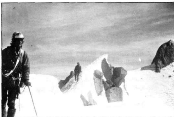
Descenso de la cumbre.

Nos encontramos en Chamonix, después de 16 horas de viaje desde Donosti y nos reunimos con unos amigos que han llegado unos días antes. Mi mujer y yo venimos por tercera vez a Chamonix, algunos de nuestros amigos también han estado antes.