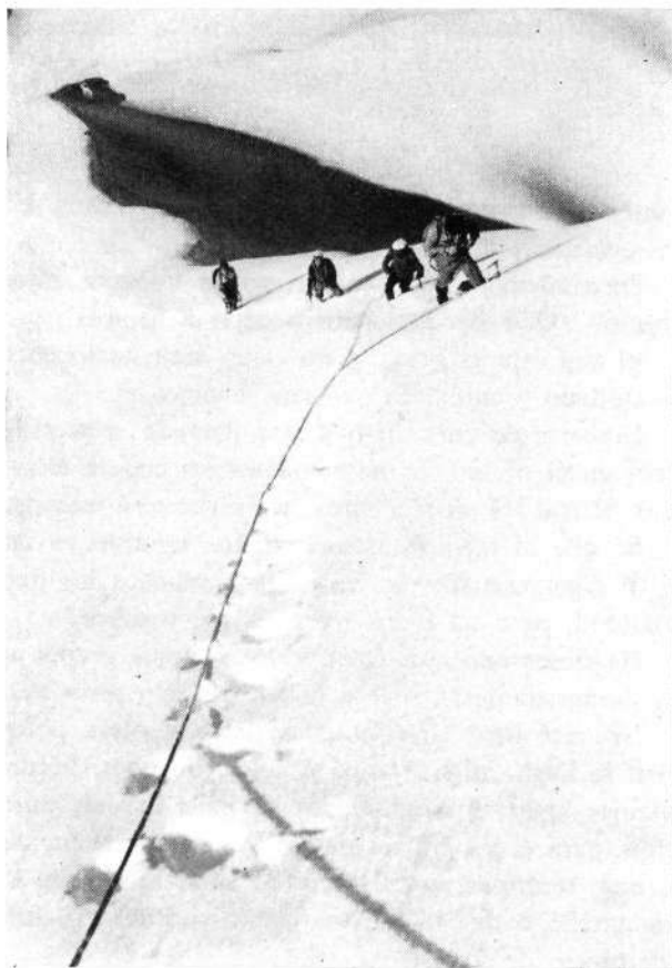
Pico de los dos esquimales

Publicación de un número extra de PYRENAICA, que se repartirá gratuitamente a los suscriptores.