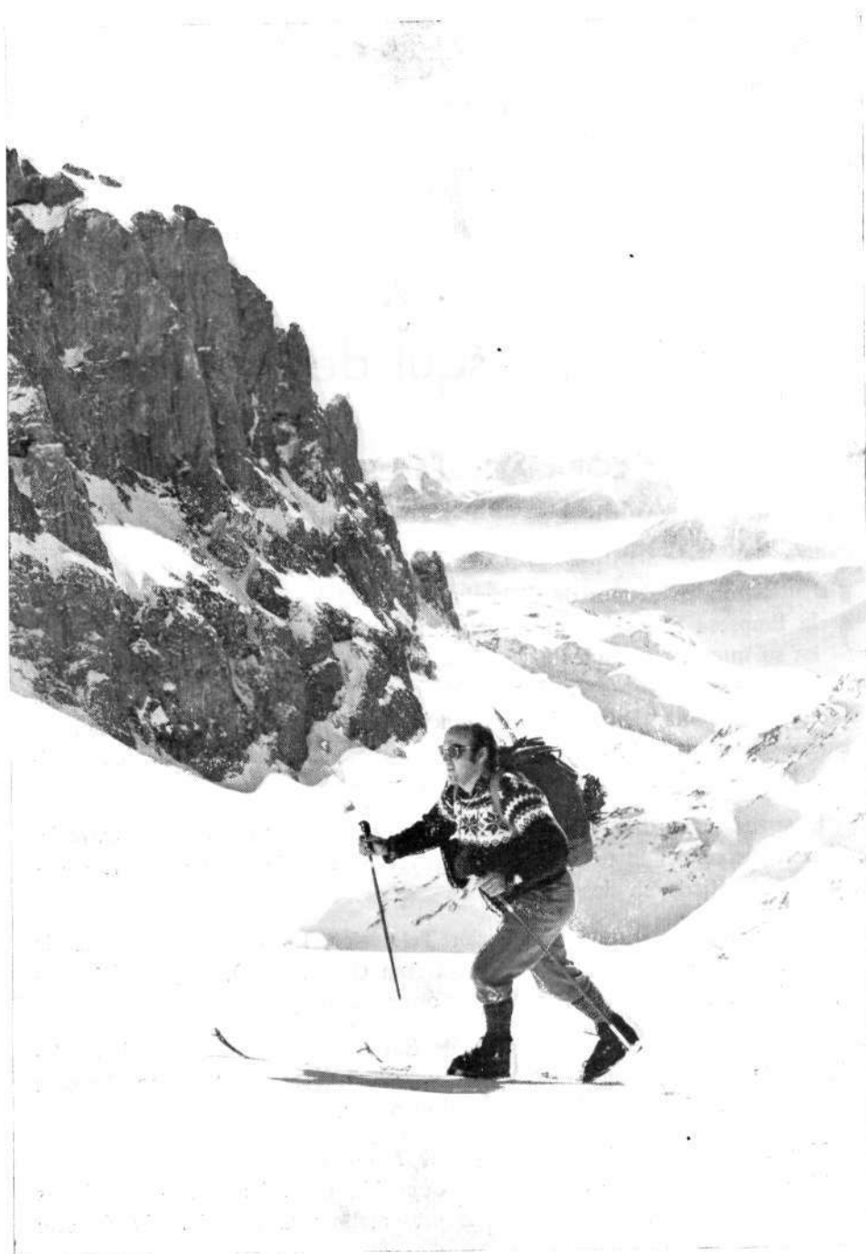
La durezza del ascenso