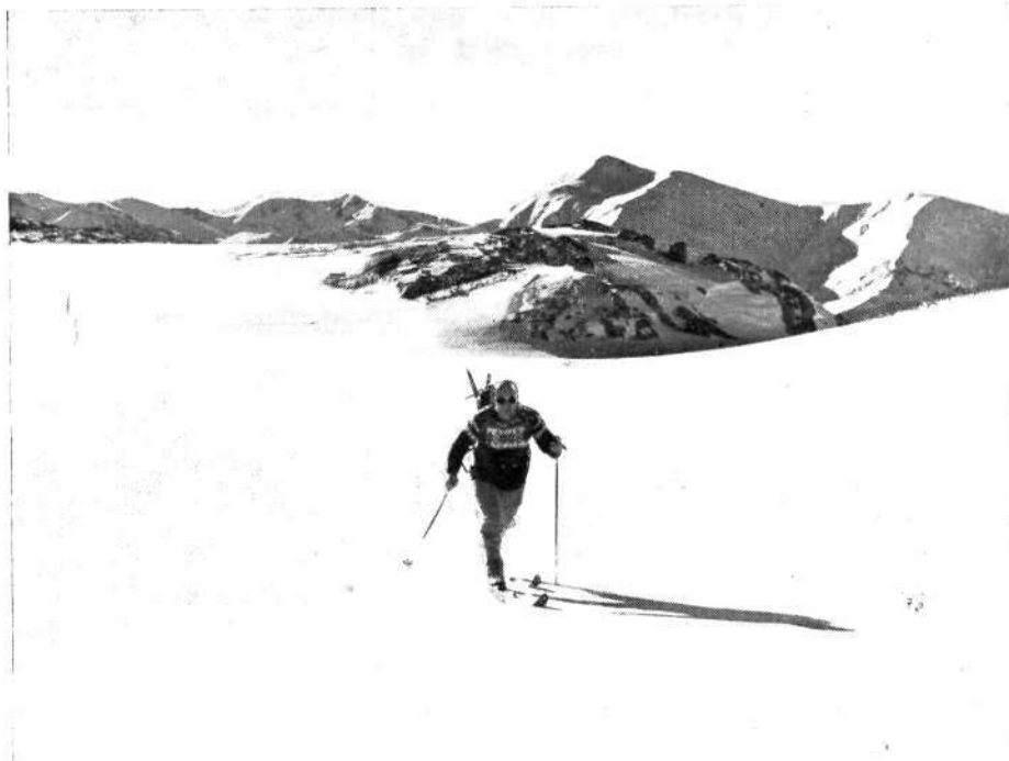
En la soledad...