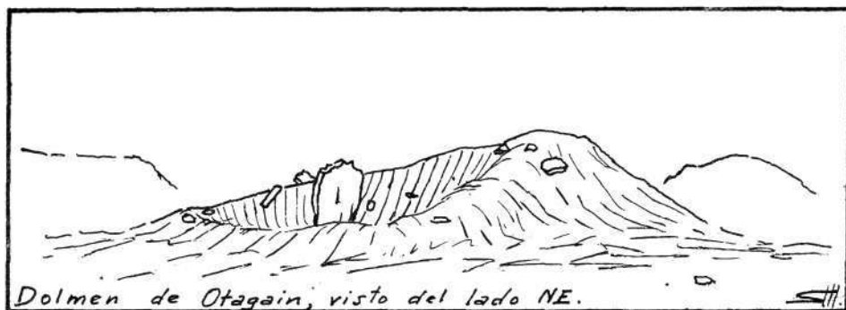
Dolmen de Otagain, visto del lado NE.