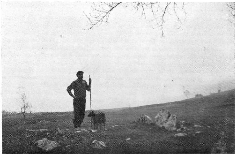
Dolmen de Zain-go ordeka, visio del lado NW.