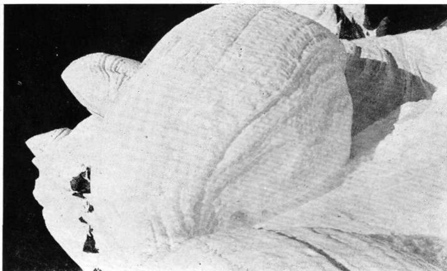
Arista NE del Huascarán.