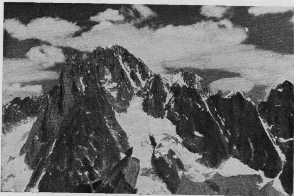
Maravillosa vista que se nos ofrecía de los Drus y la Aguja Verde durante nuestra escalada en la Aguja del Petit Charmoz.