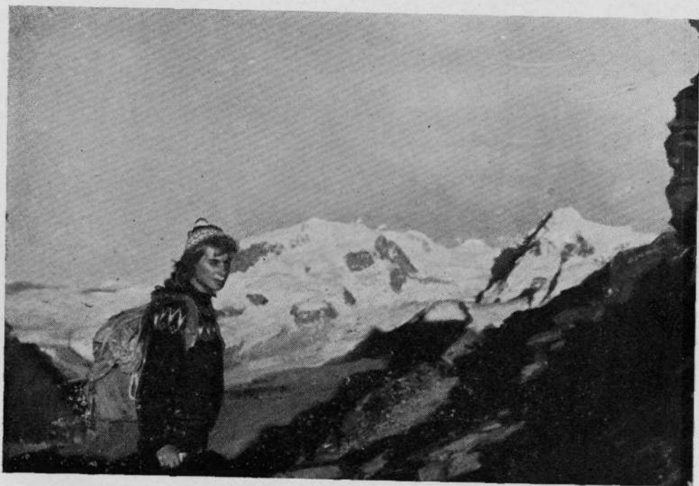
Jornaaa de aproximación al Cervino, con la belleza del Monte Rosa al fondo.