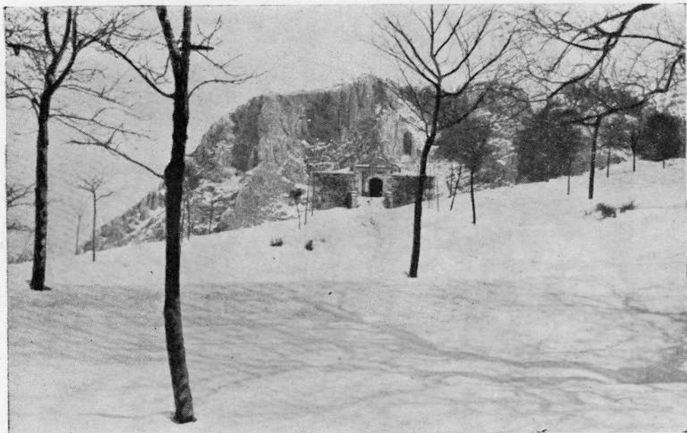
Vista de Alluitz, desde Urquiola.