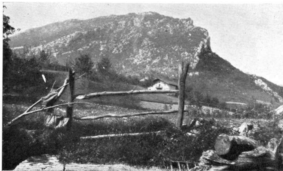
Vista de Eskubaratz, desde Mañaria.