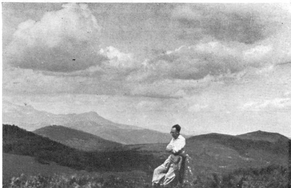
Desde la cima de Usakoaitza las cumbres, de izquierda a derecha, Albertia, Maroto o Abeta y Jarindo. Al fondo Gorbea, Aldamin y Lekanda.