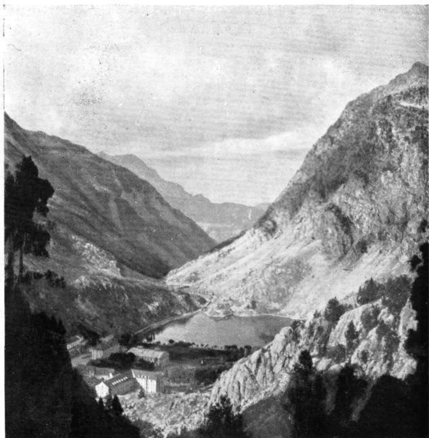
BALNEARIO DE PANTICOSA