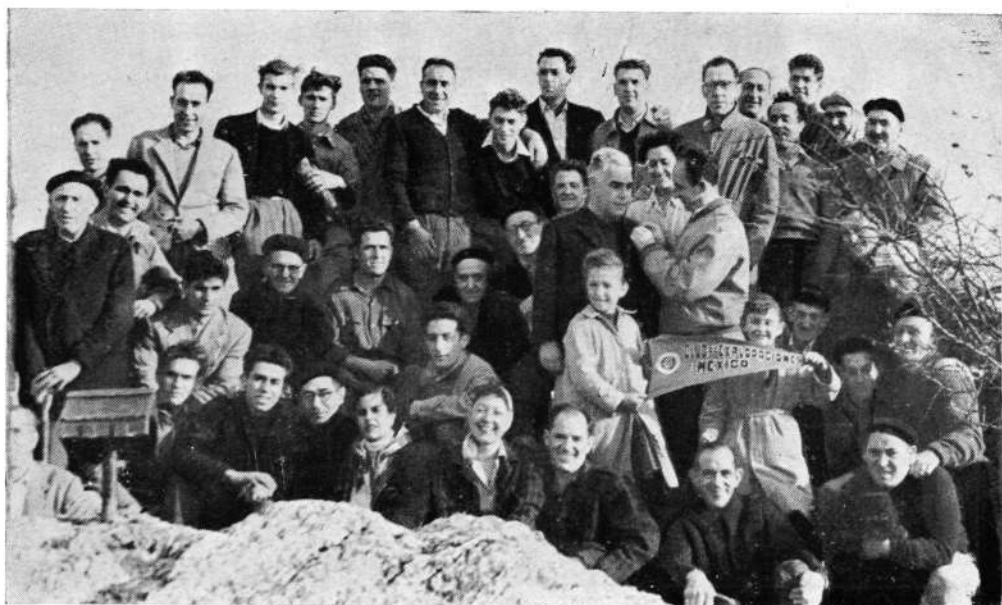
Entrega de la insignia del C. E. de México al presidente del C. D. Eibar.