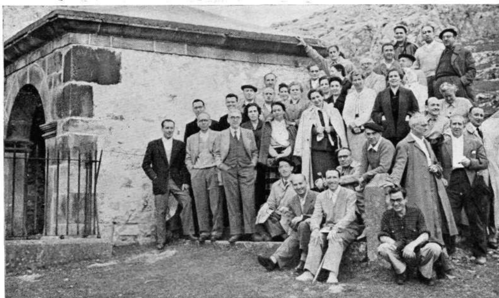
Grupo de montañeros veteranos de Vitoria, que el pasado 11 de Octubre se reunieron en la ermita de Ntra. Sra. de Oro.