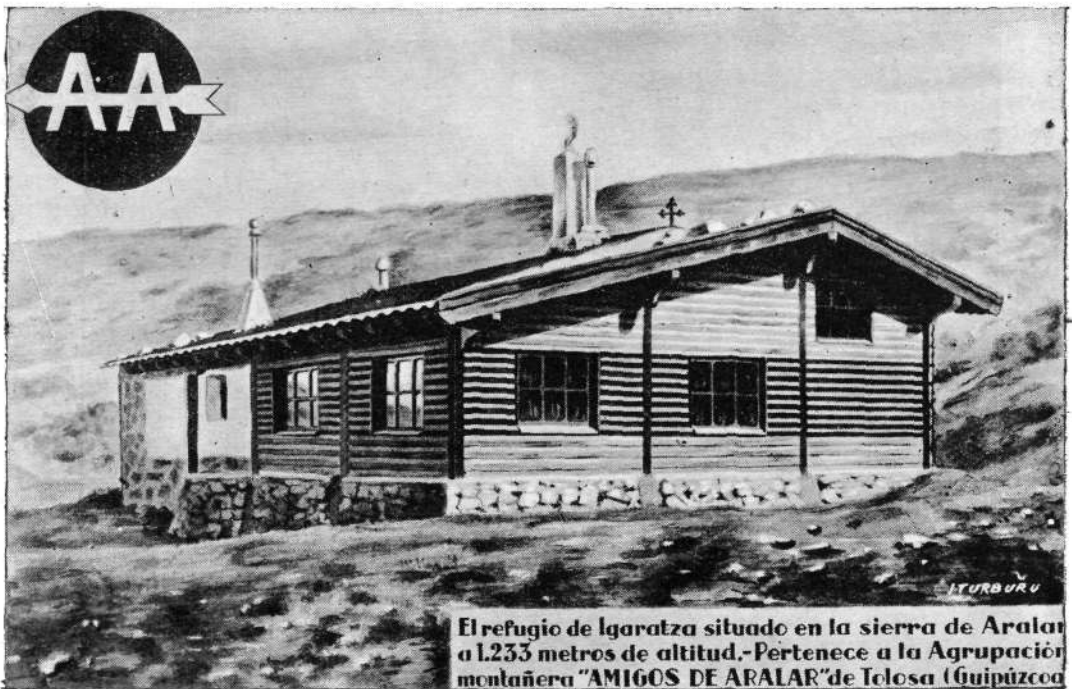
El refugio de Igaratza situado en la sierra de Aralar a 1.233 metros de altitud.-Pertenece a la Agrupación montañera "AMIGOS DE ARALAR" de Tolosa (Guipúzcoa)