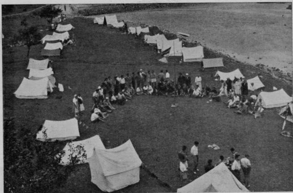
Detalle de las sesiones del I Congreso Regional de Acampada.