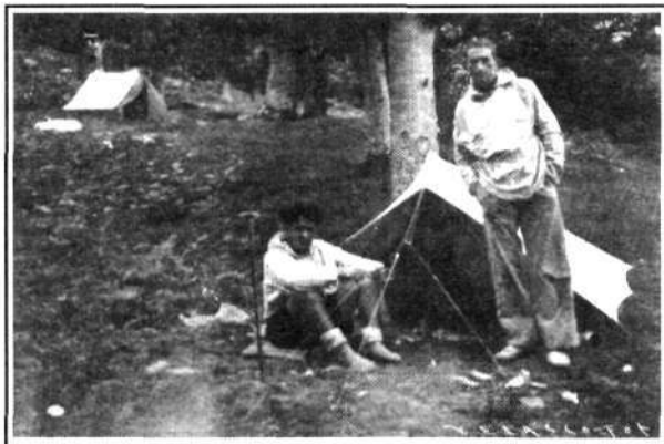
Camping en Asuntxe (Urquiola)

nuestra empresa. Apenas llevaríamos andando unos 10 minutos, cuando un chaparrón inmenso, terrible, de gruesas gotas que más tarde se convirtieron en granizo, nos cayó encima dejándonos como vulgares sopillas de ajo. Estamos hundidos de agua y el chaparrón continúa con más fuerza que antes; sopla el viento que da gusto y gracias a la capucha del «anorak» llevamos la cabeza protegida contra las terribles piedrecitas, pero las piernas que llevamos al descubierto sufren que da gusto. Llega un momento que no podemos más y nos sentamos encima de unas matas, tapándonos las piernas con las manos, pero no podemos hacer nada; cae con una furia espantosa. Como no hay un lugar ni un árbol donde cobijarse, continuamos nuestra marcha a pasos forzados-paremos esponjas-por todos los sitios nos cae agua. Por un instante la tormenta calma, lo que aprovechamos para correr más