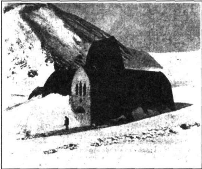
Chalet de Ull de Ter.