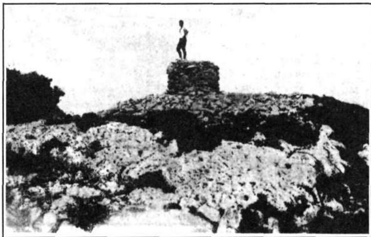
Mojón de la Sierra de Kodes.

A la entrada del pueblo, por la parte de Vitoria, se encuentra, a mano izquierda, una casa noble, la de los Díaz de Antoñana, según reza el escudo que ostenta en su