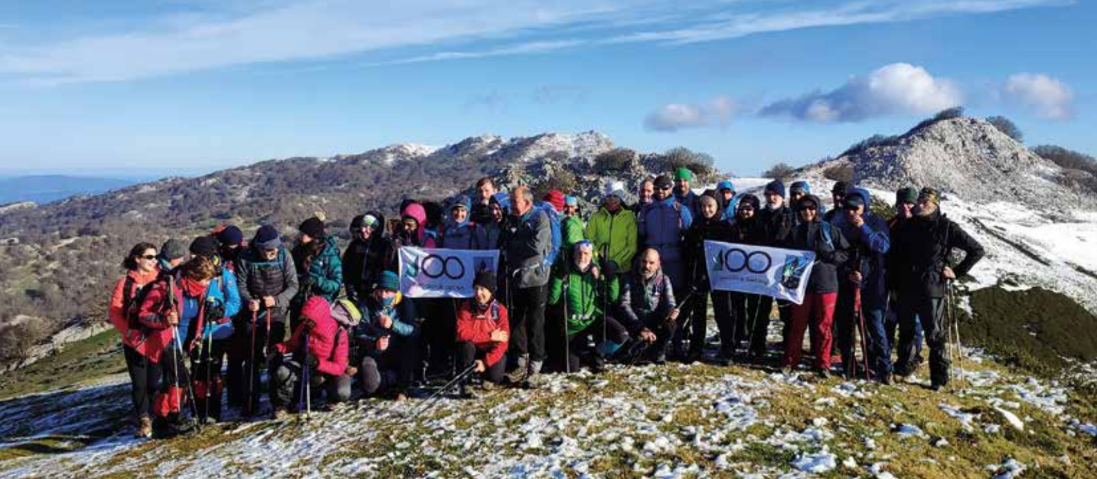
En la cima de Ipergorta el Día de la Hermandad de Centenarios de 2023

El concurso de centenarios consiste, básicamente, en ascender a cien de estas cumbres recogidas en el catálogo en un periodo comprendido entre 5 y 10 años naturales, no pudiendo computar más de 20 cimas por año ni más de una por día. Pero, además, hay una serie de requisitos adicionales que deben tenerse en cuenta, ya que al menos 75 cimas deben ser de Euskal Herria (aceptándose, dentro de esas 75 cimas, montes especificados en el catálogo como “anejos” al territorio histórico correspondiente). Para poder participar hay que estar federado por la EMF durante el tiempo que dure el concurso.