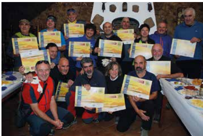
Entrega de diplomas el Día de la Hermandad de Centenarios de 2018