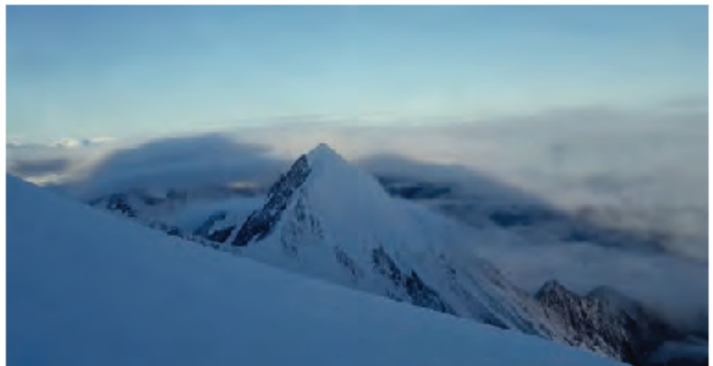
Aguila du Biomassay

Iritsi gara azkenean tontorrera, hasierako 30 segundo edo minutuko tartean ez dago ospakitzunik. Nekatuta iritsi garenez, arnasa hartzeko probesten dugu. Behin gorputzari buelta poka bat emanda, orduan bai gozatzeko unea da. Besarkadak eta oihuak tartekatzen dira. Europako mendi altuenean eta munduko famatuenetako batean egotearen poztasunak gorputz osoa zeharkatzen du. Begiak azkar mugitzen dira, den-dena ikusi nahi dute. Mendi asko lainopean egon arren, gutxi batzuk ikusi ditzakegu, eta horiei begira