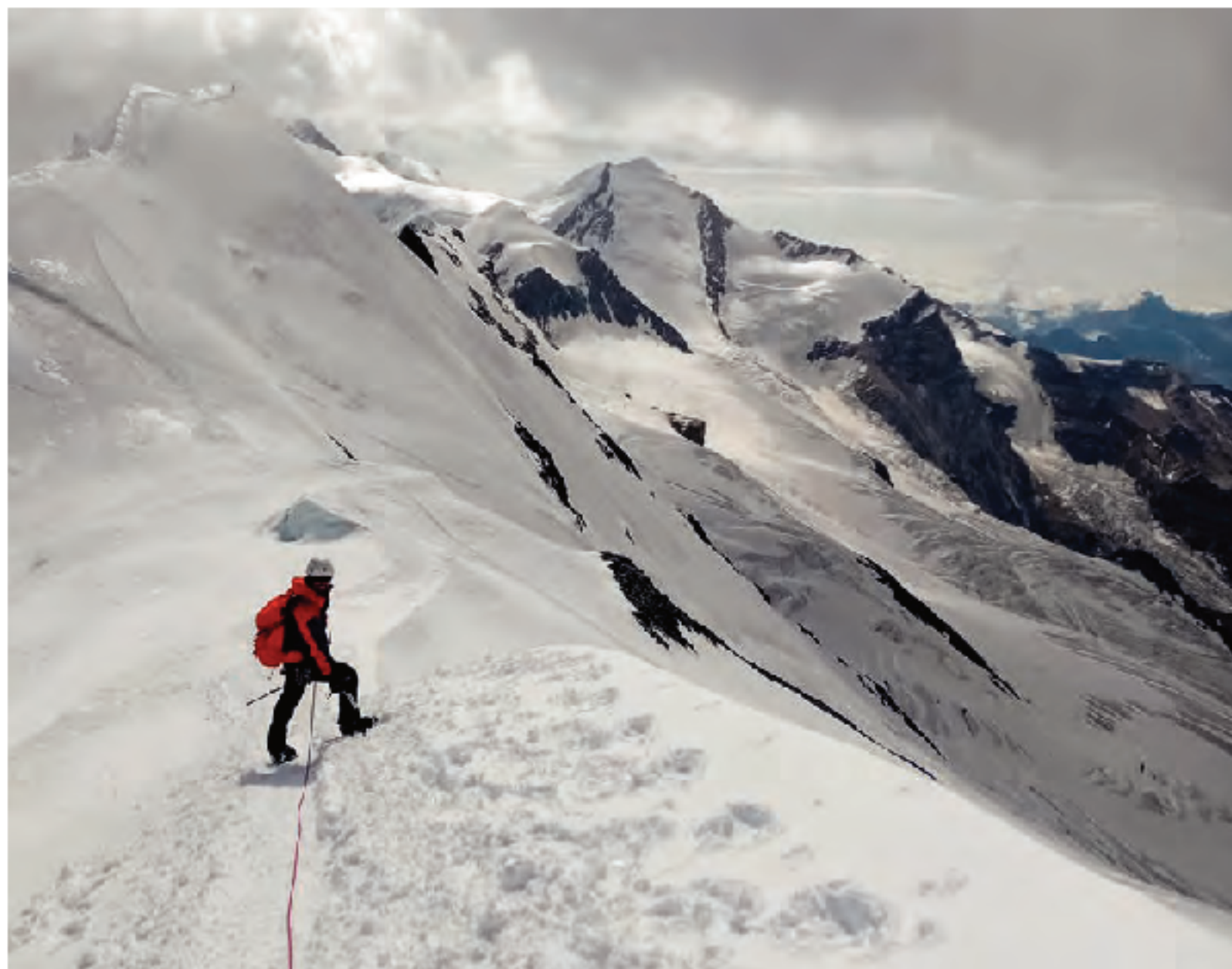
Roche Faurio eta Breithorn igo genituen Mont Blancera abiatu aurretik kaluerara egokitzeko

Esan bezala, guretzat garrantzitsua zen ibilbide oso oinez egitea eta gainera Tête Rousseko aterpetxean (3167 m) lo egitea. Goñterreko aterpetxea altuera handiagoan dago (3815 m), baina nahia- go genuen hain famatua ez den eta hain masifikatua ez dagoen aterpetxean aterpetu. Beraz, ibilaldia gogorragoa izango zen baina ez genuen zalantzarik horrela burutu behar genuela.