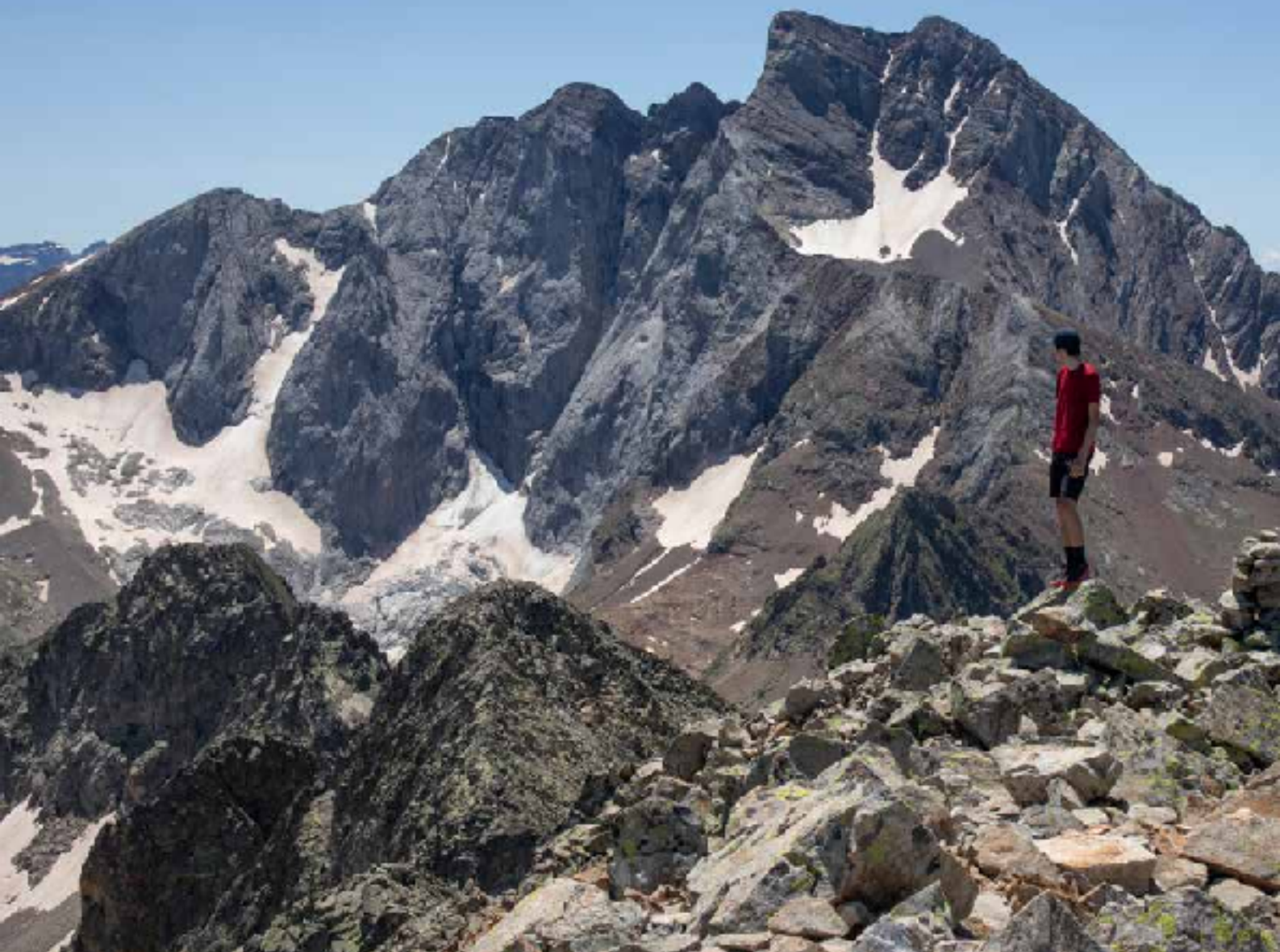
En la cima de Alphonse Mellón con el Vignemale de fondo

El gran lago aparece de la nada y aprovechamos para hacer una parada y reponer fuerzas. Sin embargo, queda lo más duro, pues podemos observar justo enfrente nuestro objetivo, 700 metros por encima de donde nos hallamos. Retomamos la marcha en dirección al collado de Arratille y, tras poco más de 10 minutos andando, habrá que estar atentos para localizar un pequeño hito a la altura de una gran canal que baja directamente desde la cima a nuestra izquierda. Este hito nos indica que tendremos que salirnos del sendero para iniciar la ascensión final por esta loma inclinada que acabará convirtiéndose en una canal con una pedrera infernal. Estos 600-700 metros de desnivel finales