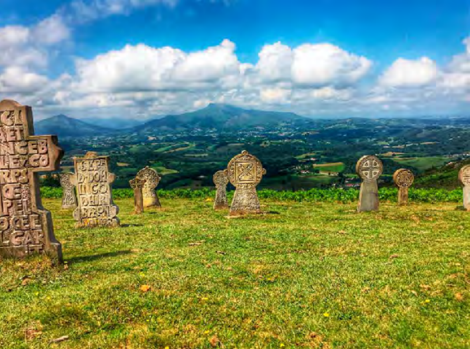
Arantzako Ama Birjina naren kaperaren ondoko hilarrak

bat monumentu erlijioso baki bat da eta santu bat gurtzeko eraikitua dago. Sara, eraikin erlijioso gehien duen euskal herria da.