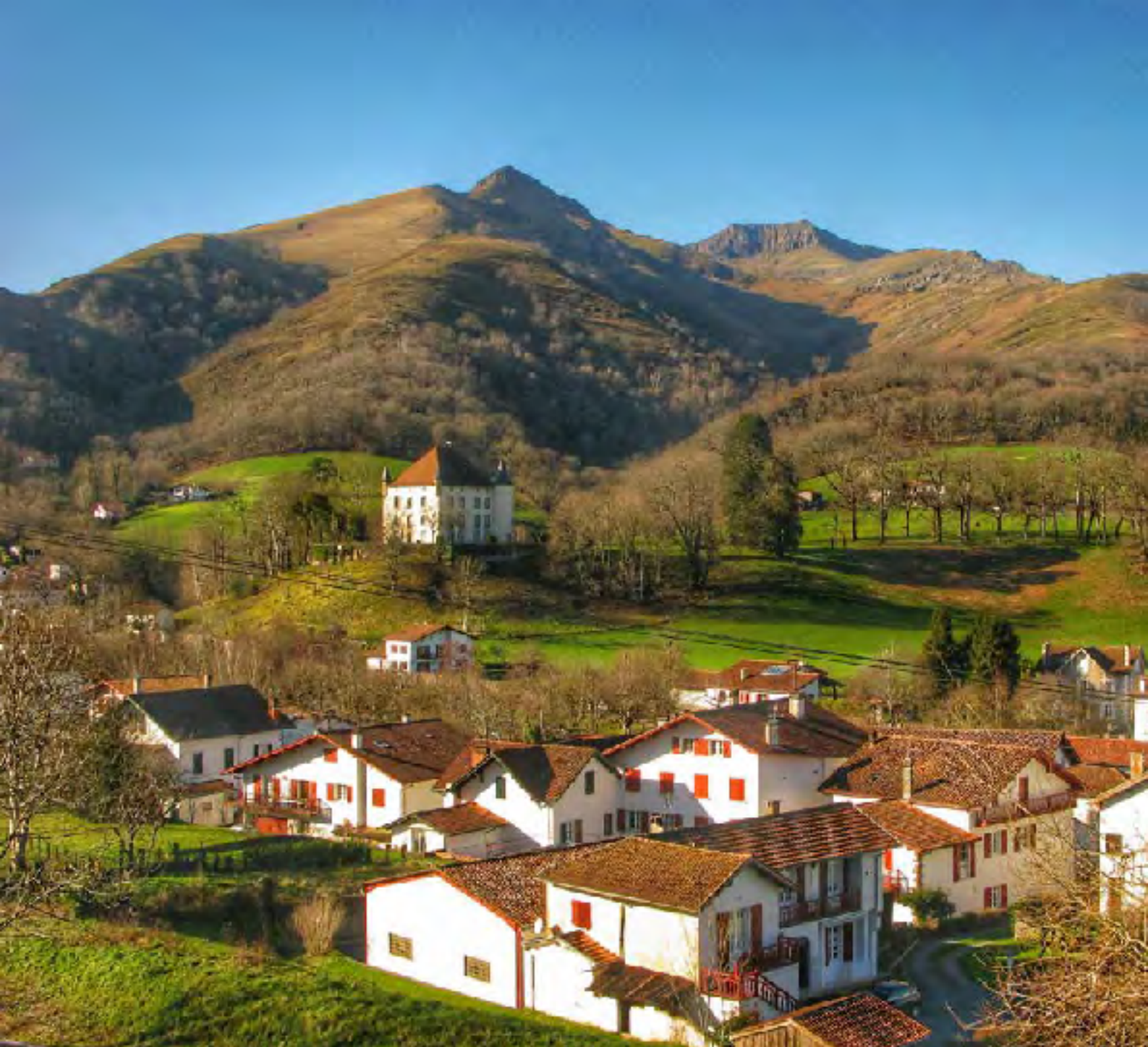
Baigorri herria eta Etxauzko gaztelua

dagozkion bide-seinaleak jarraituko ditugu eta lepo txiki batera heltzean metro batzuk bete beharko ditugu. Tutuliako gailurrera iristeko. Iparla eta Tutulia dira Gapeluko zirkoa mugatzen duten bi gailurrak. Putreek ere lekua bilatu dute zirkon honetako mailakartan. Altuera azkar galduko dugu eta Harrietaso lepora iristean, Urdozera doan bidea ezkerrean utzi eta igotzen hasiko gara. Astatetako tontorren gertuago ikusi dugu helmuga, baina oraindik izen bera duen lepora jaitsi beharko dugu. Buztanze laira igotzeko azken maldan aurre egiteko.