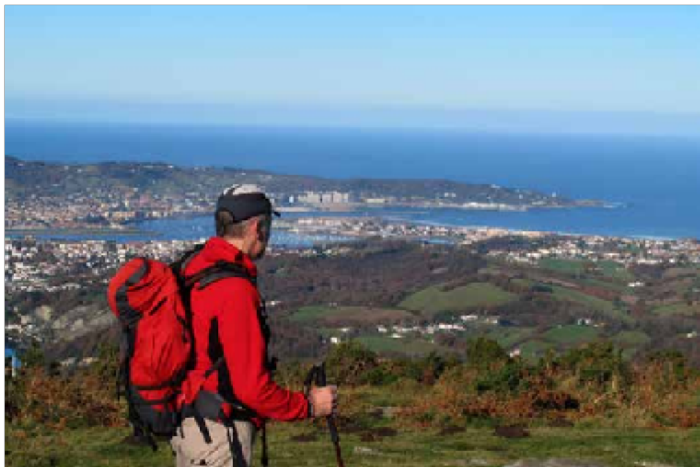
Txingudiko badia Xoldoko gainetik

San Martin elizaren ondotik igaro, hilerriaren hormen ondotik pasa eta berehala, Kukutxoa etxearen aurretik pasatu eta