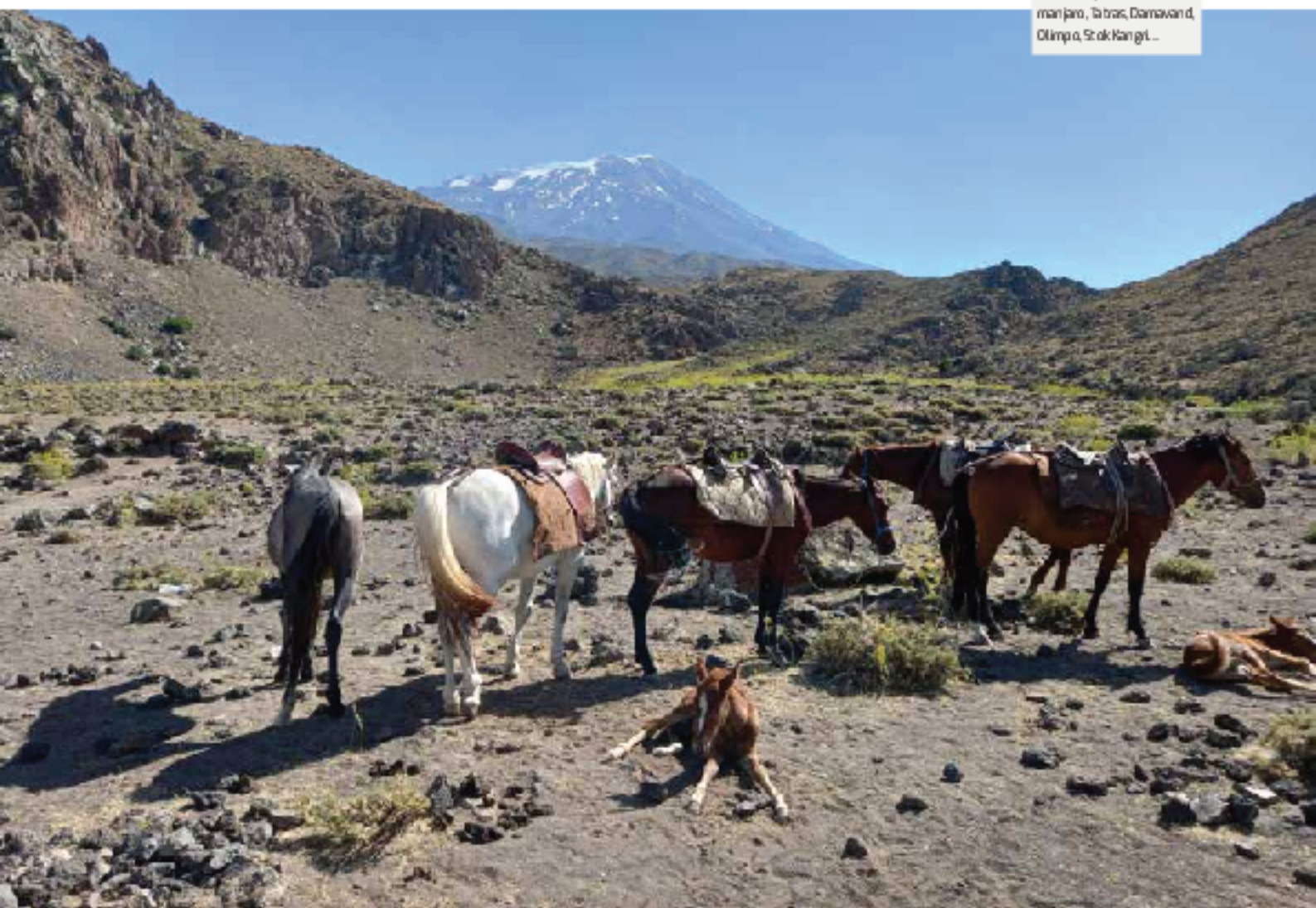
Lehen kanpalekura ko bidean