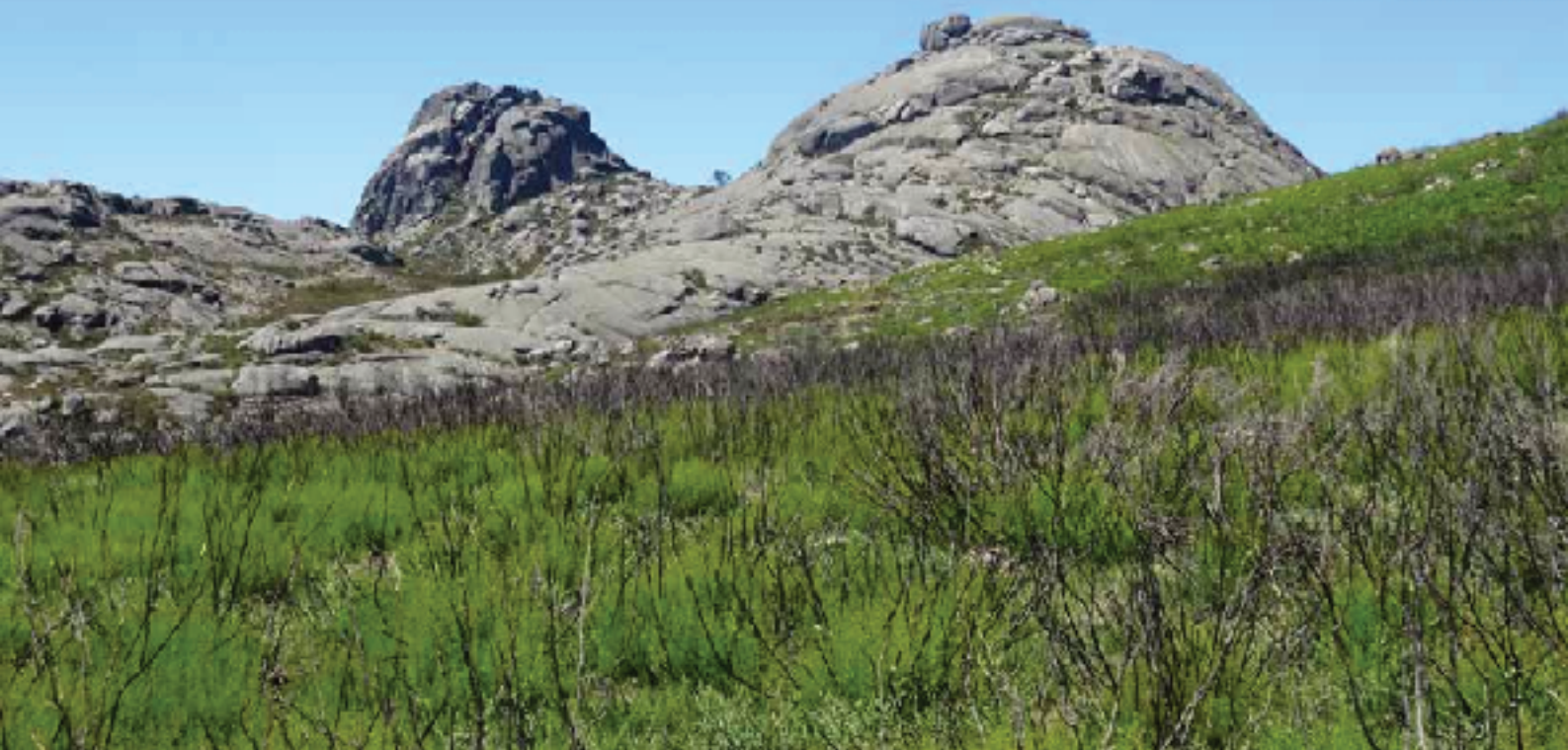
La Pena de Anamán desde la Serra de Quagras

jornadas, ya que caminar de noche por estas montañas es una temeridad, además de que te pierdes el disfrute del paisaje.