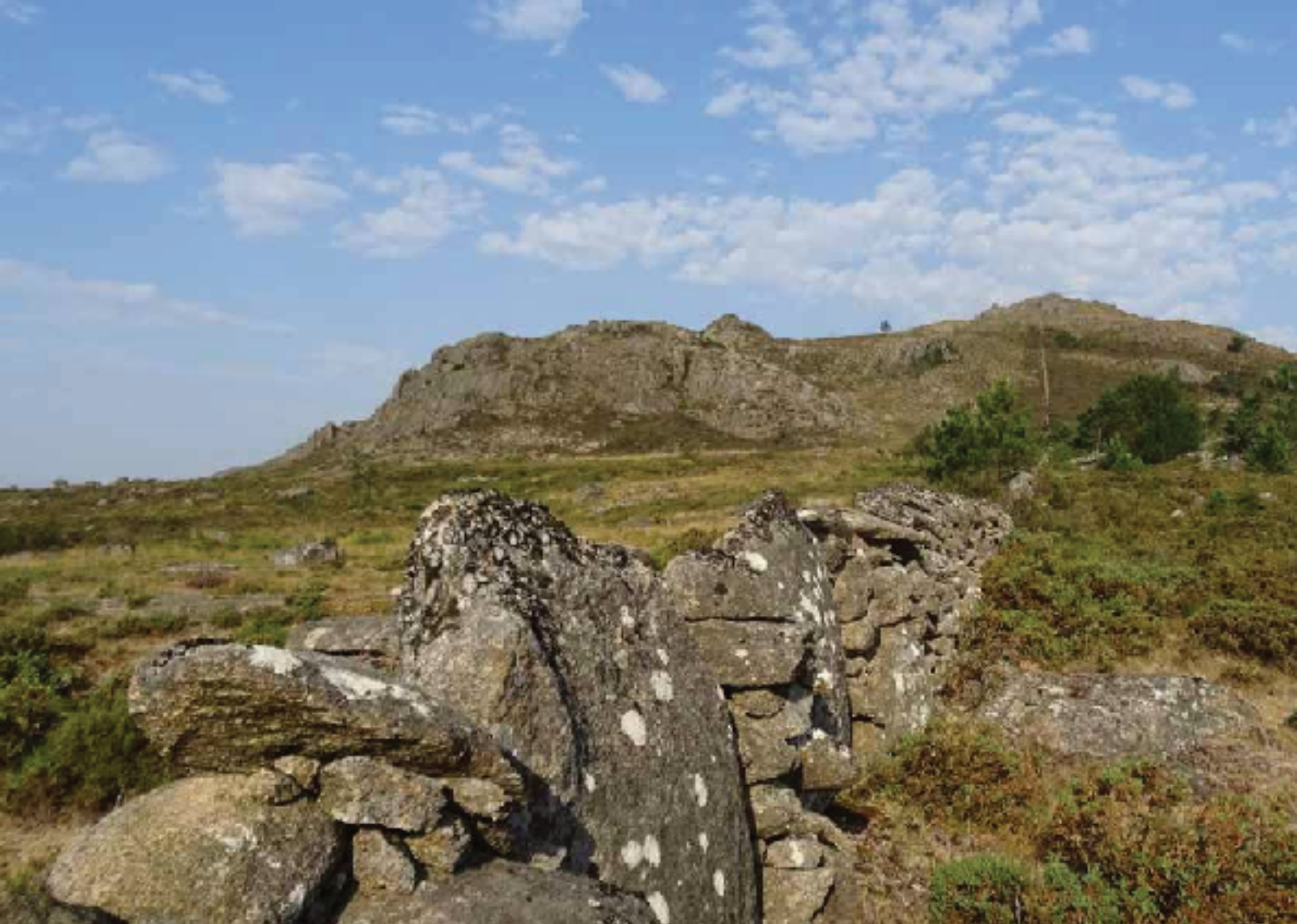
Línea fronteriza hacia la Cruz do Tauro

oeste se ve un pequeño sendero con algunos hitos que conducen a la cumbre más representativa, y segunda en altura, de esta sierra: Coto de la Fontefría (1457 m). Aunque se puede subir por varios sitios, el más asequible es la ladera oeste ya que hay una serie de escalones en los que, en algún momento, hay que agarrarse con las manos, sobre todo en el descenso.