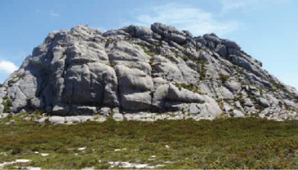
Vertiente norte del Pico da Moura

y campo a través hasta los 950 m. Breve descenso para cruzar la Corga do Porto do Medio y a continuación, por la vertiente sur, ascender por donde mejor se podía.