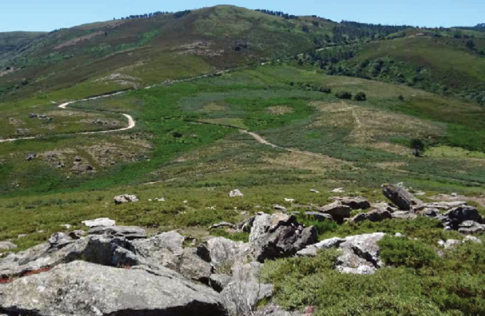
La Serra do Risco desde el Alto de O Curisco

se trata del Pedroso (1301 m), una montaña de la parroquia de Castro Laboreiro. Estas montañas están entre la Serra de Queguas y la de Laboreiro.