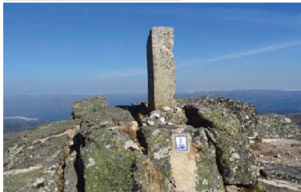
Marco e imagen de la Virgen de Fátima en la cima de la Fontefrã

Breve descenso hacia la última fuente que íbamos a encontrar en los siguientes 25 kilómetros, que por suerte seguía con agua. Desde aquí subimos directos hacia el marco G-197. En este lugar hacia el