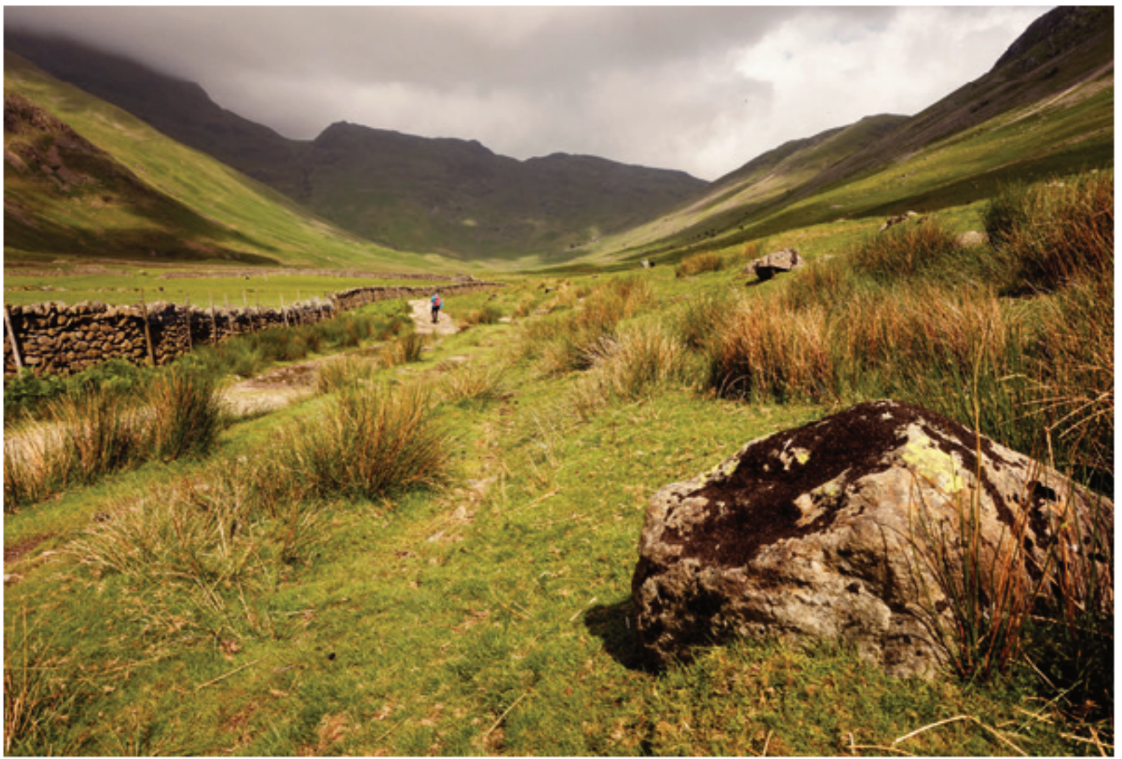
Mickleden harana, Cumbria Way

2018ko artikulua hark proposatzen zituen hiru ibilbideak itxiak ziren, hasi eta bukatu leku berean egiten zuten. Guk proposatzen ditugunak ere "ferra" (horshoe) iturakoak dira edo, nahiago bada, zirkularrak. Baina, eguraldiaren aidakortasunarekin batera, bada inguru honek duen ezaugarri