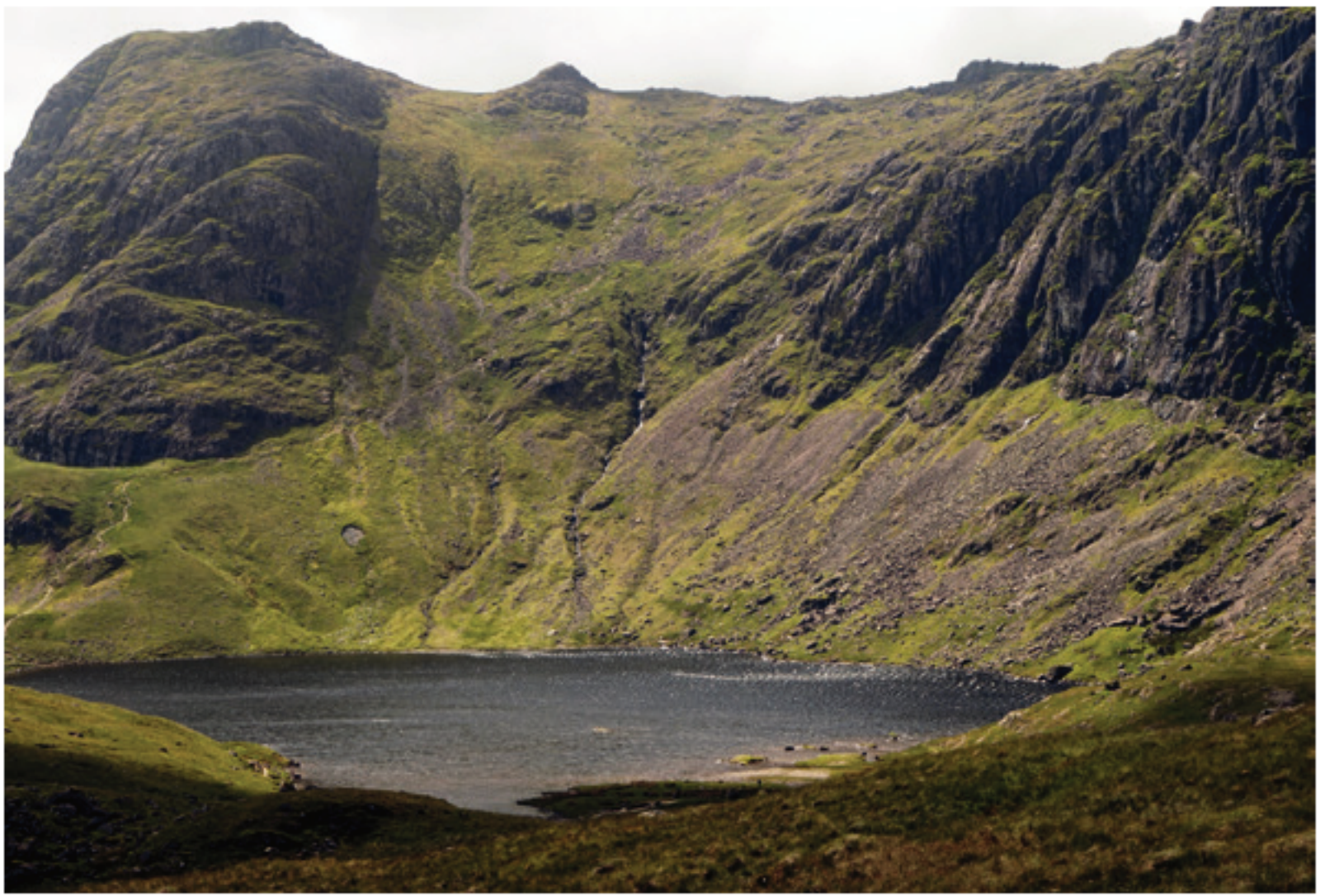
Stickle Tarn. Pavey Arketa Harrison Stickleartearen

deen, xenden higadura ekartzen du berarekin. Bideen higadura eta haien inguruetako hondamena saihesteko asmoarekin hemengo erakunde batzuek (National Trust, National Park Authority) bideak harlauzez estaltzeari ekin zioten. Mendizale batzuen iritziz harlauza horiek labainkorrak dira hezetasun edo izotz baldintzetan (hau da, ia beti) baina, orokorrean, politika horrek kalte baino on gehiago egiten dio inguruneari.