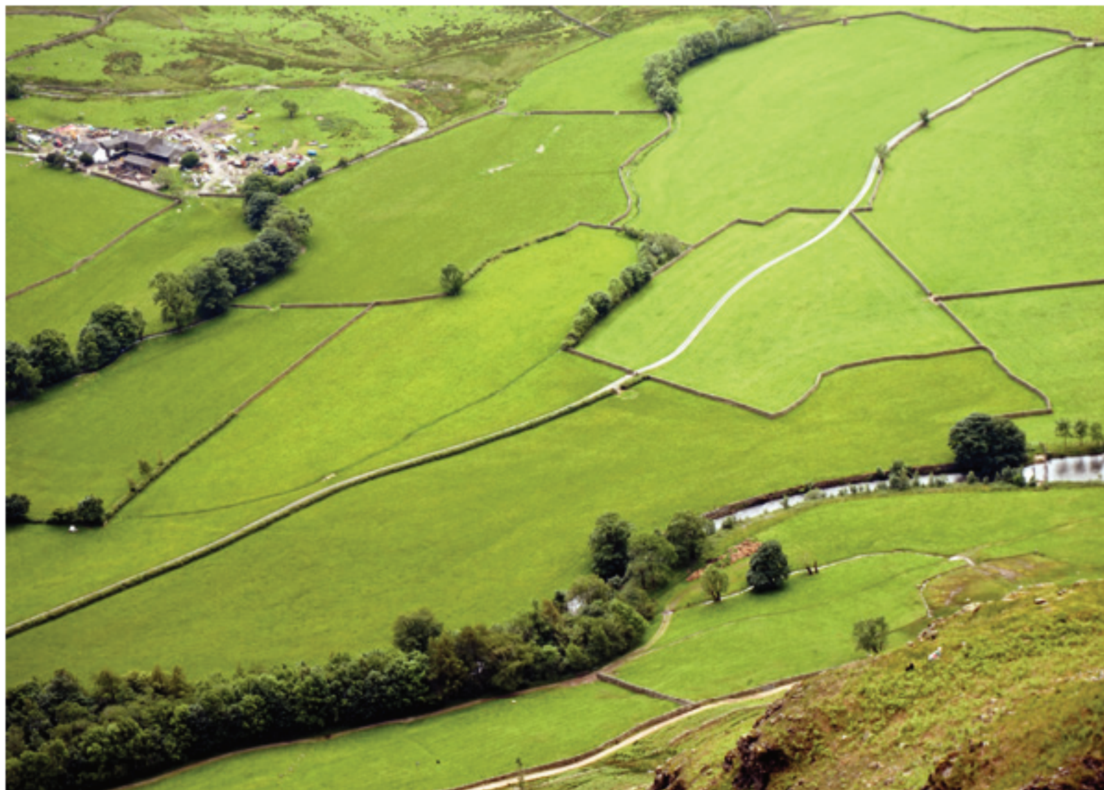
Stool End Farm

gara; ez da beharrezkoa, lehenagoxeago eskuinera hartu behar da. Grange herrira iritsi baino lehen, ibaiaren ertzean, hamaitakoa egin dugu; leku zoragarria horretarako. Grange-n taberna-gozotegibatean garagardo bat hartu dugu lasai-lasai. Gero, errepidea utzi ondoren, basoan gora egin dugu erreka xarmangarri baten aldamenetik. Watendlath Beck haranetik izen bereko aintzirara heldu gara. Tarte hau ezin ederragoa da. Lasai eta berriketean autora iritsi gara.