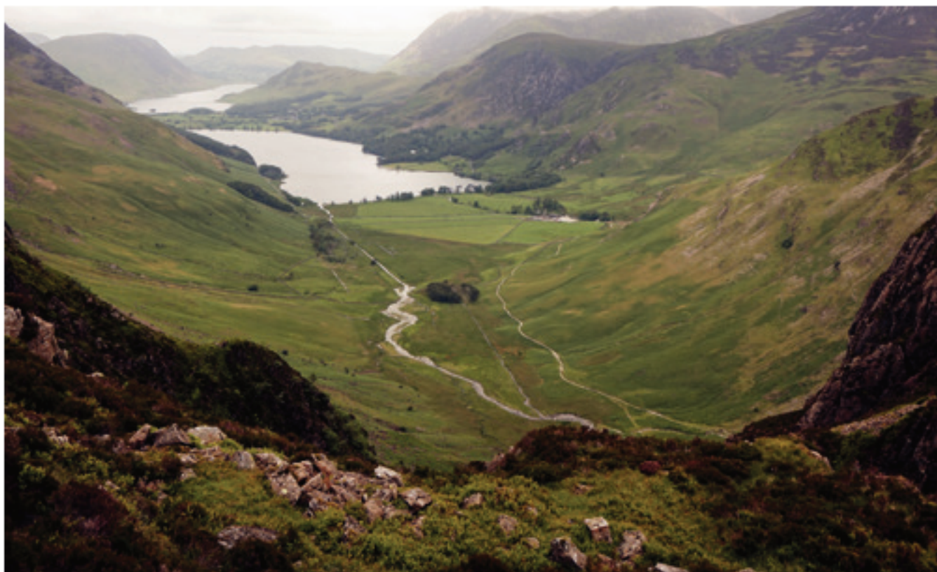
Buttermere aintzira, Haystack-etik

tan babestu ahal izateko. Nola edo hala Sergeant Man-era iritsi gara. Goi hauetan ibiltzea gozamen hutsa da. Aurrerago, zoko gune batean aterpetuta, eguzki-izpi lotsati batzuen goxotasunean, atseden laburra hartu dugu (dena esaten hasita siestatxo bat ere egin dugu). Stickle Tarn aintziraren ondotik pasa eta gero ibilbidea itxi dugu erreikaren aldameanean, arretatsu jaistea exijitzen duen xenda batetik.