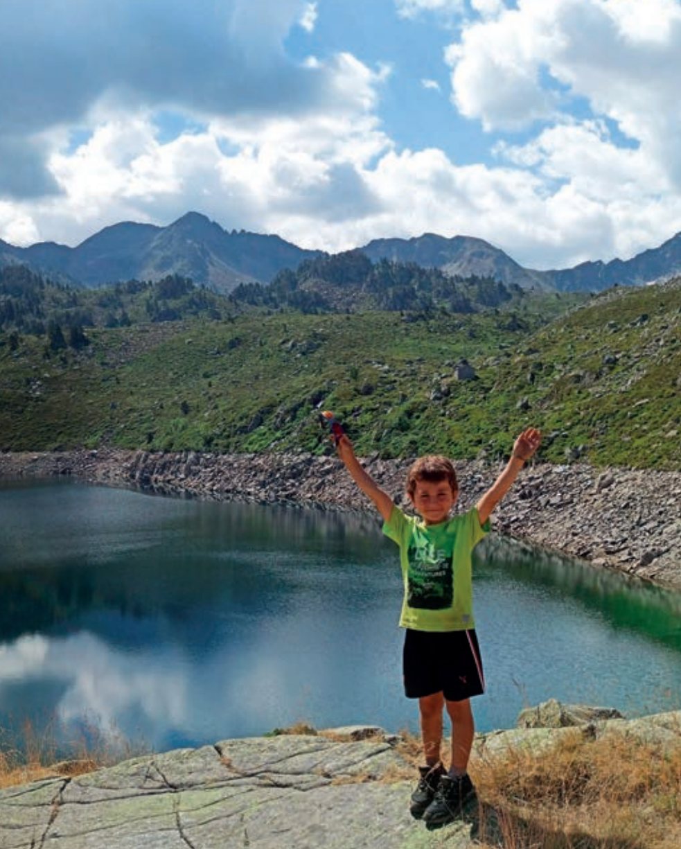
Lac dets Coubous

los últimos pasos que nos harán ganar el resalte que queda en la zona superior derecha. Una vez arriba, frente a nosotros aparece el lago y, a nuestra izquierda, nos encontraremos un refugio libre, Cabane dets Coubous , donde podremos pasar una noche a resguardo en caso de necesidad, ya que dispone de una chimenea para hacer fuego y una tarima para poder echarnos.