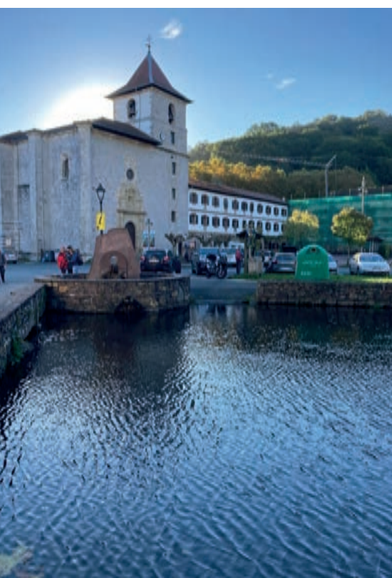
Urdazubiko San Salvatore monasterioa

Hemendik Ainhoaraino bidea gorabeheratsua gertatuko zaigu. Lehendabizi baso landatu berri bat zeharkatzen duen lurrezko bide pikotik igoko gara harrobira ailegatu arte eta gero, asfaltatuko errepide zabaletik jaisten hasiko gara gure eskuinera hedatzen den pista zabal batekin topo egin arte. Lan-