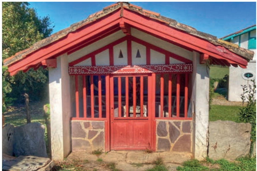
Sarako San Migel oratorioa

Euskal Herrian beti izan dira sorginak. Jakina da herritar askok beraiengana jotzen zutela sendagaien bila, sendabelar, ukendu eta aholku eske. Baina eliza katolikoak ez zuen