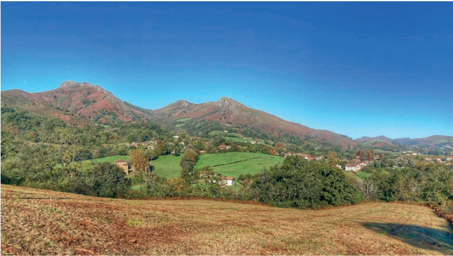
Larhun aldeko ikuspegia

egiten da, eta Arxuriako mikazko plakek eguzkitan daudenean sortzen duten distirari begira, magalera gerturatuko gara xenda batekin bat eginez. Bidea estutu egiten da tarte honetan, eta maldan behera egingo dugu apartakaleku batera iristeko. Azken aldapa txikiak, Sarako lezeetako sarreran utziko gaitu.