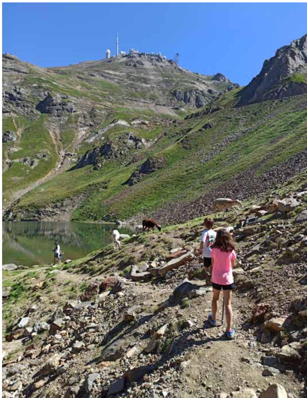
Llegando al lac d'Oncet, bajo la mirada del Pic deth Mieidia de Bigòrra

Ya intuimos la cuenca en la que se recoge el agua del lac d'Oncet, en la ladera sur del Pic du Midi. Justo antes de llegar vemos los restos de un nevero, que servirán de zona de juegos para niños y niñas, deslizándose sobre la nieve dura.