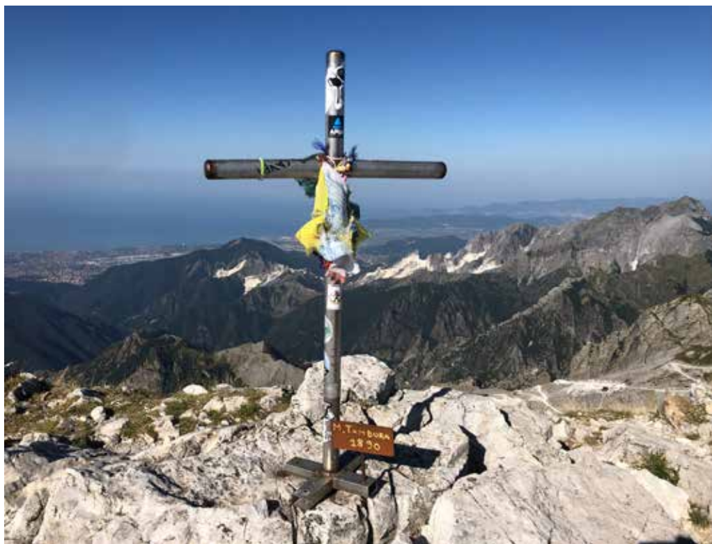
Cima Monte Tambura

Passo della Focolaccia con Monte Cavallo detrás y Monte Pisanino al fondo