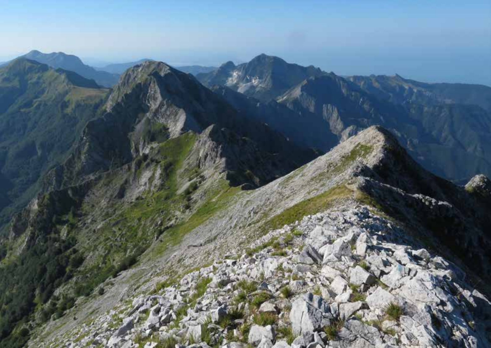
Cresta cimera desde Passo della Tambura con Monte Focioletta al fondo