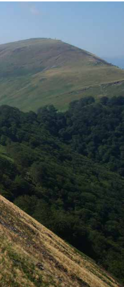
Descenso por la cresta meridional de Alkaxuri. Por la izquierda asoma la loma de ascenso desde Urritzate

año, gana altura primeramente bajo el arbolado para posteriormente salir a terreno despejado.