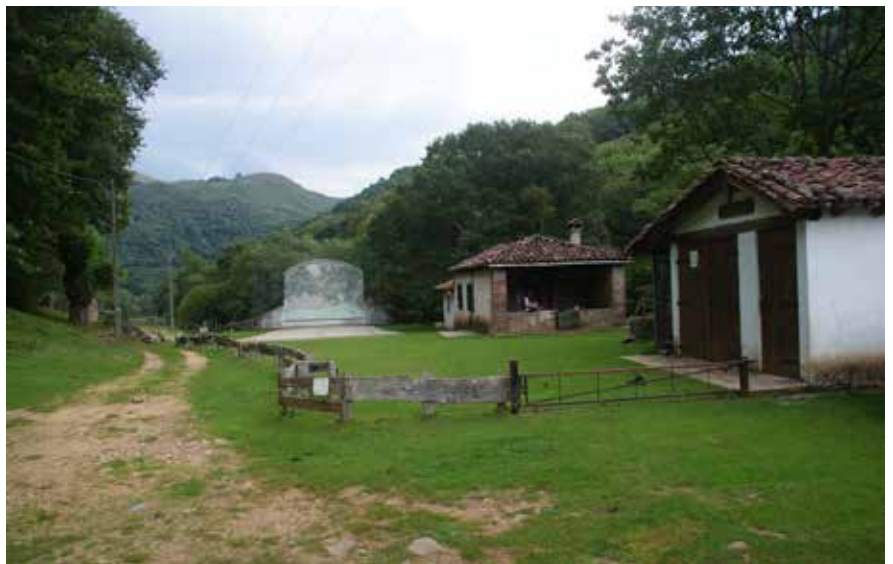
Escuela y frontón en Aritzakun

Deberemos estar atentos al lugar en el que un hito señala el punto en el que abandonamos Urritzateko bidea para desviarnos por la izquierda (NW) en busca del puente que salva el cauce de Urritzateko erreka. Una vez atravesado este, una marcada senda que pudiera estar algo cerrada dependiendo de la época del