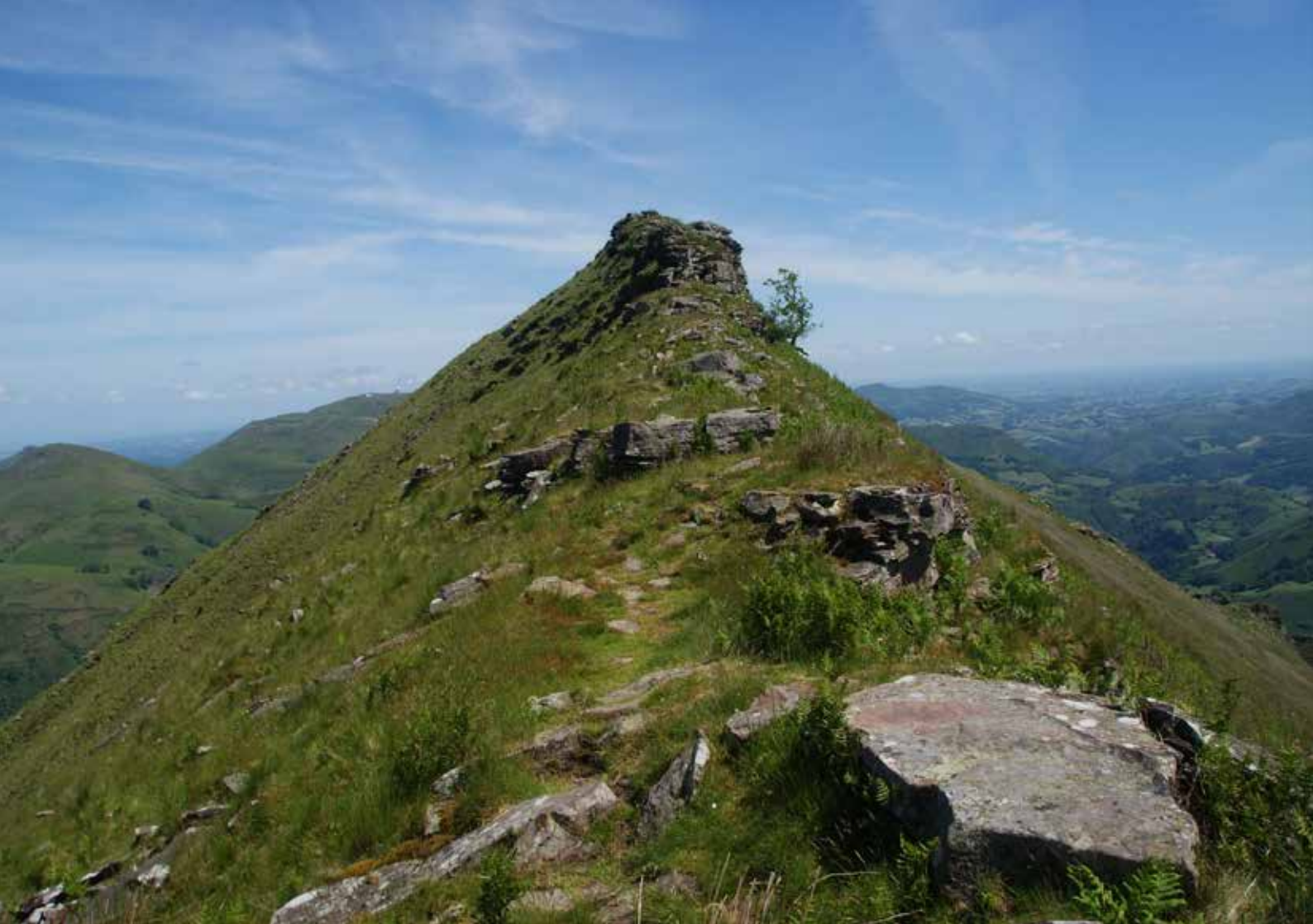
Cresterío meridional hacia la cima de Alkaxuri

truyó una base norteamericana, de la que aún hoy se pueden ver algunos restos.