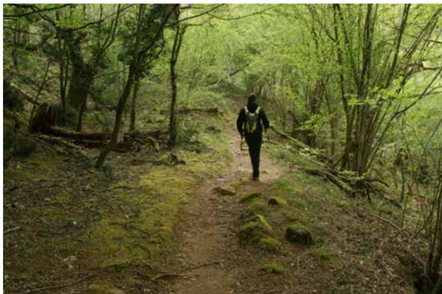
Camino en Minetako zokoa