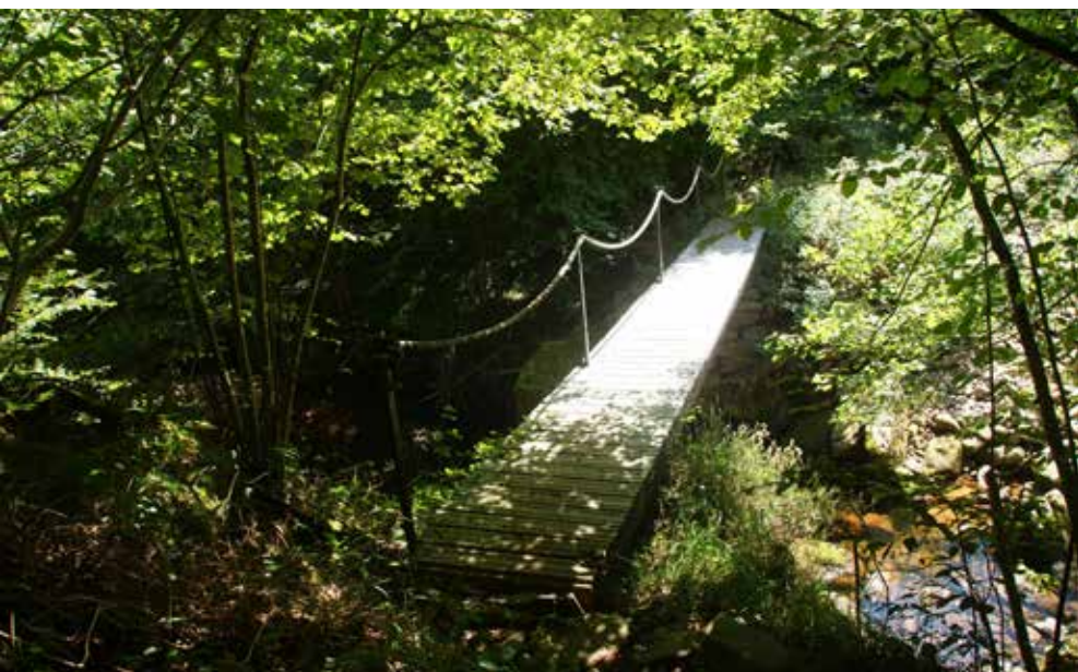
Puente sobre Urritzateko erreka

Para el regreso vamos a utilizar la ruta nº 1 que, en plácido discurrir, nos devolverá al punto de partida.