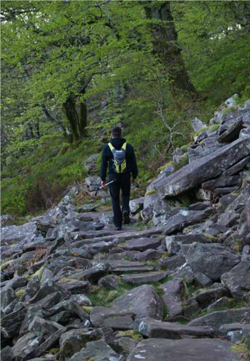
Tramo de calzada en el camino de Itzulegi a Alkaxuri

(965 m), sencilla loma por la que, sin excesivas dificultades, remontaremos en fuerte pendiente hasta desembocar en la pequeña explanada herbosa que corona su cumbre.