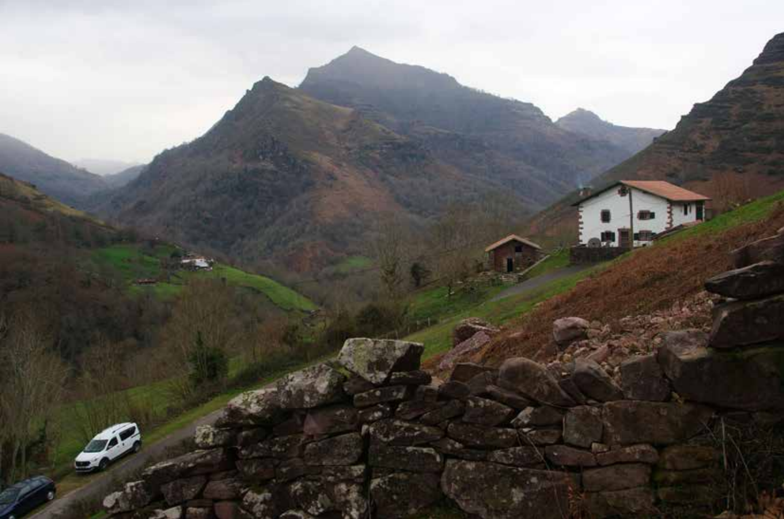
Alkaxuri visto desde la casa Arouchia (Bidarray)

ka, terminar dando alcance a Larratezarreko zubia, puente que tomaremos como principal referencia para iniciar la exigente ascensión por la conocida vía del Circo de los Asfódelos.