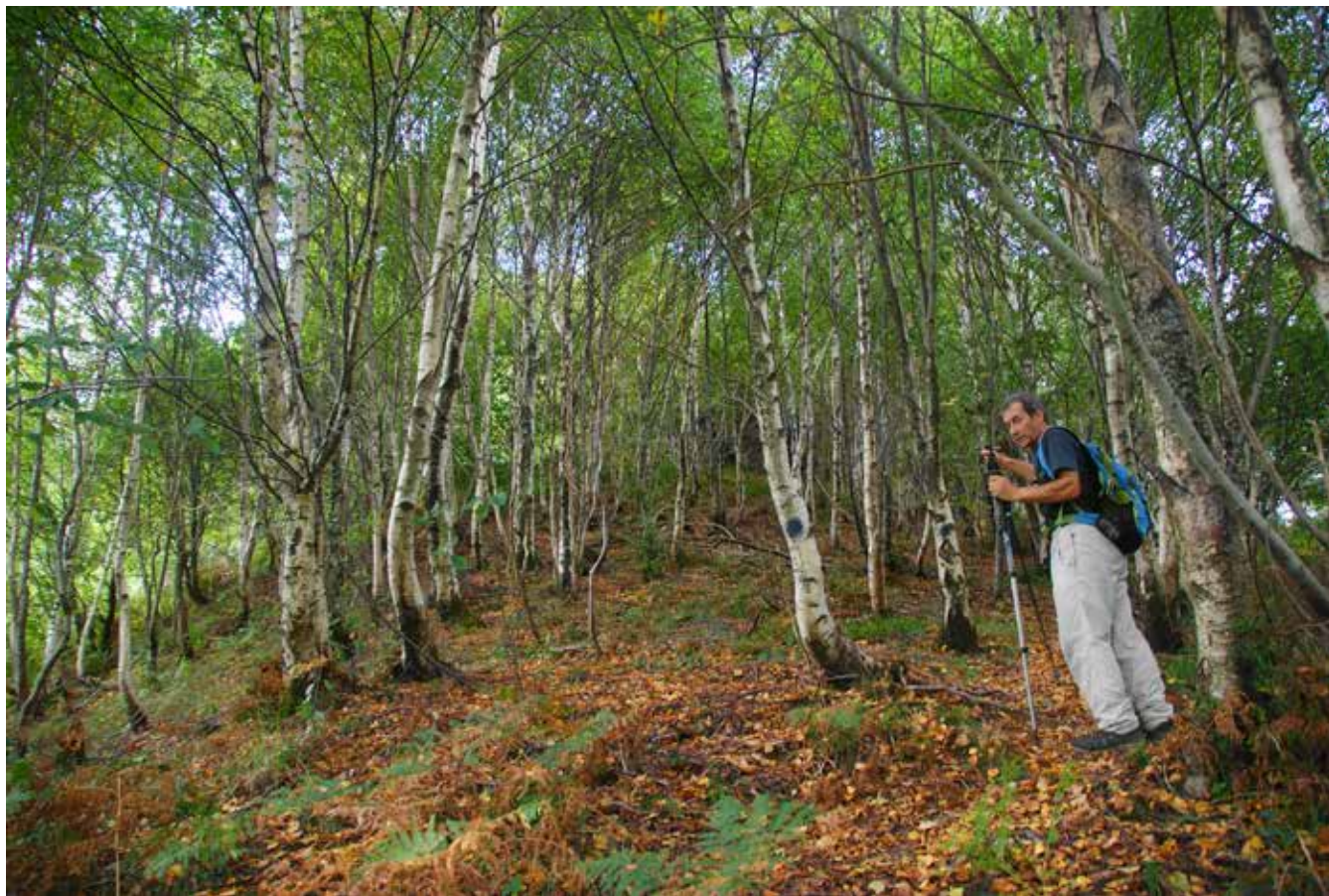
Marcas de pintura balizan el camino que asciende por la Vía de los Asfódelos

No sin poco esfuerzo terminamos alcanzando la base de la rocosa cresta NE de Alkaxuri