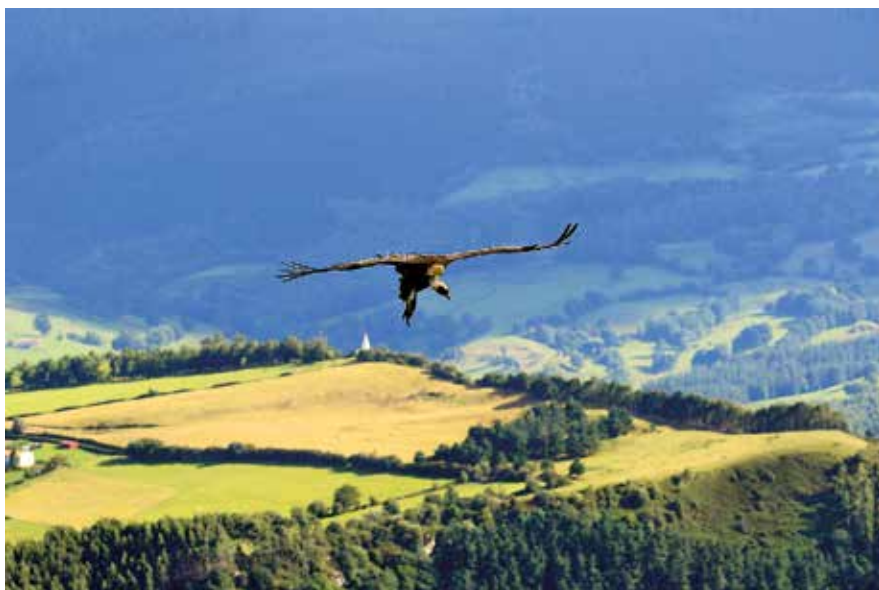
Buitre leonado sobrevolando con el monumento a la Virgen del Buen Suceso al fondo · AUTOR: MITXELANDREU

camino a izquierda que, bajo los farallones de Armañón, nos adentra en este espectacular bosque mediterráneo que representa un tipo de vegetación de tipo esclerófilo, es decir, de hojas endurecidas y siempre verde, al contrario que la mayoría de bosques de Bizkaia, cuya vegetación es de hoja caediza, propicia de clima templado.