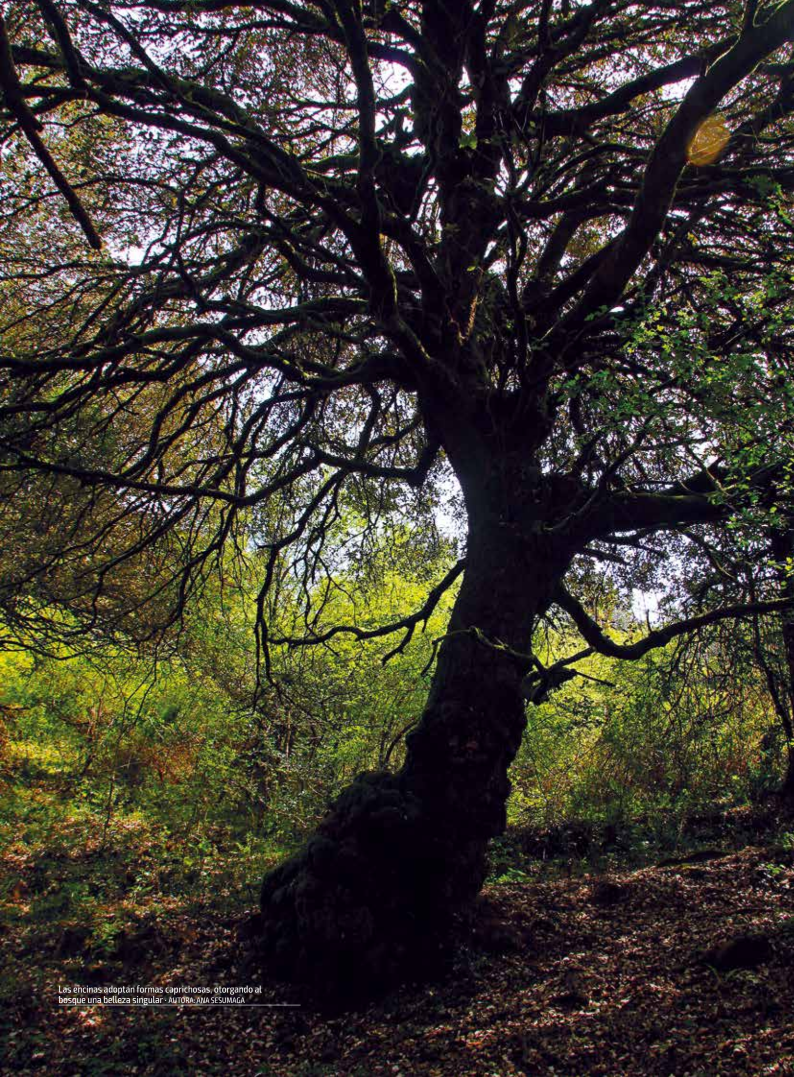
Las encinas adoptan formas caprichosas, otorgando al bosque una belleza singular