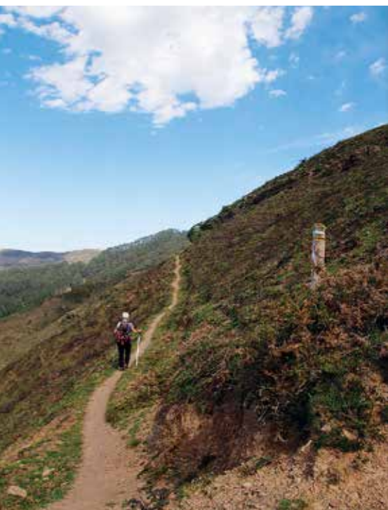
El sendero se estrecha a su paso por el monte Coterón

blancas y amarillas del sendero. En 270 m nos topamos con un depósito de aguas (1 h). Muy cerca de él, llegamos a un punto donde hay una señal vertical que nos indica que a la izquierda debemos descender hacia el encinar. El descenso se realiza por una senda tortuosa entre ejemplares aislados de encinas y monte bajo. A medida que descendemos la densidad de árboles es mayor. El bosque aflora entre las rocas cubiertas de musgo, encinas y castaños centenarios. Continuamos atravesándolo, ahora junto a un cerramiento de malla y estacas de acacia, el cual evita que acceda el ganado, al mismo tiempo que permite que el bosque pueda regenerarse de forma natural y los árboles muertos puedan ser sustituidos por otros árboles jóvenes (1 h 17 min). Seguimos descendiendo hasta alcanzar una señal vertical junto a una pista de tierra (1 h 22 min). Abandonamos la senda y cogemos la pista hacia la izquierda. A escasos metros de este cruce nos encontramos de nuevo con otra bifurcación, donde cogemos nuevamente la pista de la izquierda. Avanzamos 250 m para encontrarnos con otro cruce de pistas, allí una vez más viramos a izquierda. Continuamos descendiendo y recorridos 340 m llegamos a la pista procedente del barrio de Santecilla, lugar donde finaliza el paseo por el encinar. En este punto se ubican una señal vertical y un letrero de madera que anuncia "Encinar Sopena" (1 h 32 min).