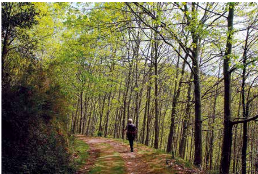
Plantación de roble americano junto al sendero

se encuentra el panel informativo del sendero junto con una señal vertical que nos indica a Sopena 5,5 km (0 h).