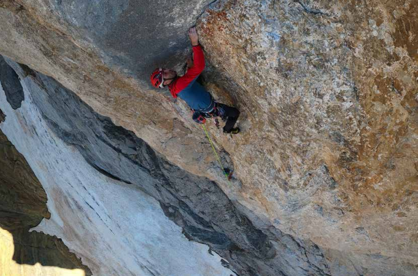
Ekaitz Bizi Bizitza bidean, 310m 8b. Pic Du Cascade Orientale 3161m