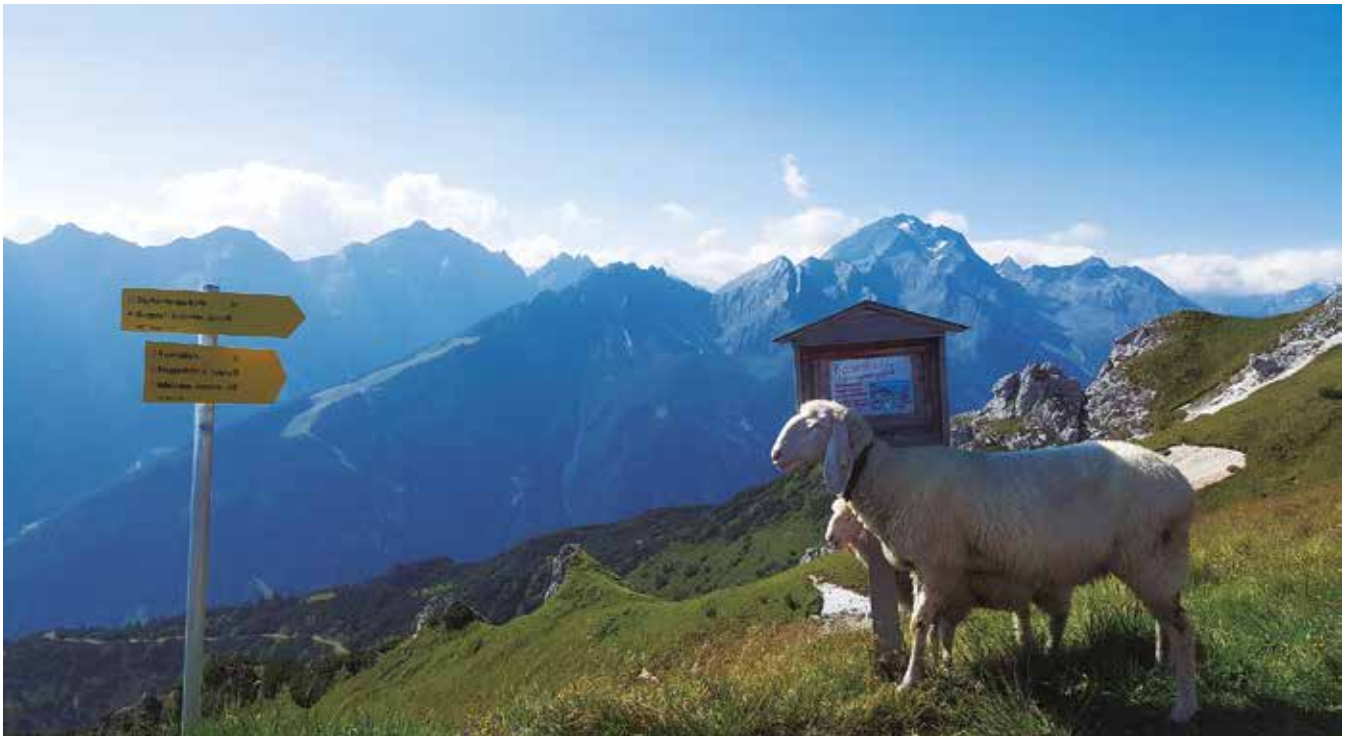
Elfer, Zwölferspitze y Habitch

nos subir a 3, también hay obsequio en forma de camiseta conmemorativa. ¡Todo un detalle!