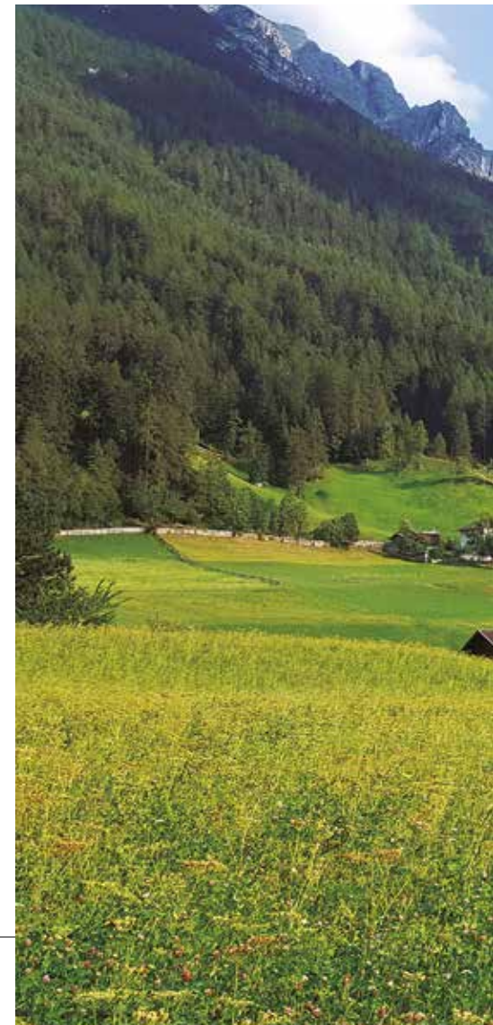
Vista desde Neder

No podemos entretenernos mucho en la cumbre y -teniendo en cuenta que el último telecabina parte a las 16 h- descendemos todo lo rápido que nos permite la prudencia. Llegamos con puntualidad británica a la estación pensando que si hubiéramos perdido este