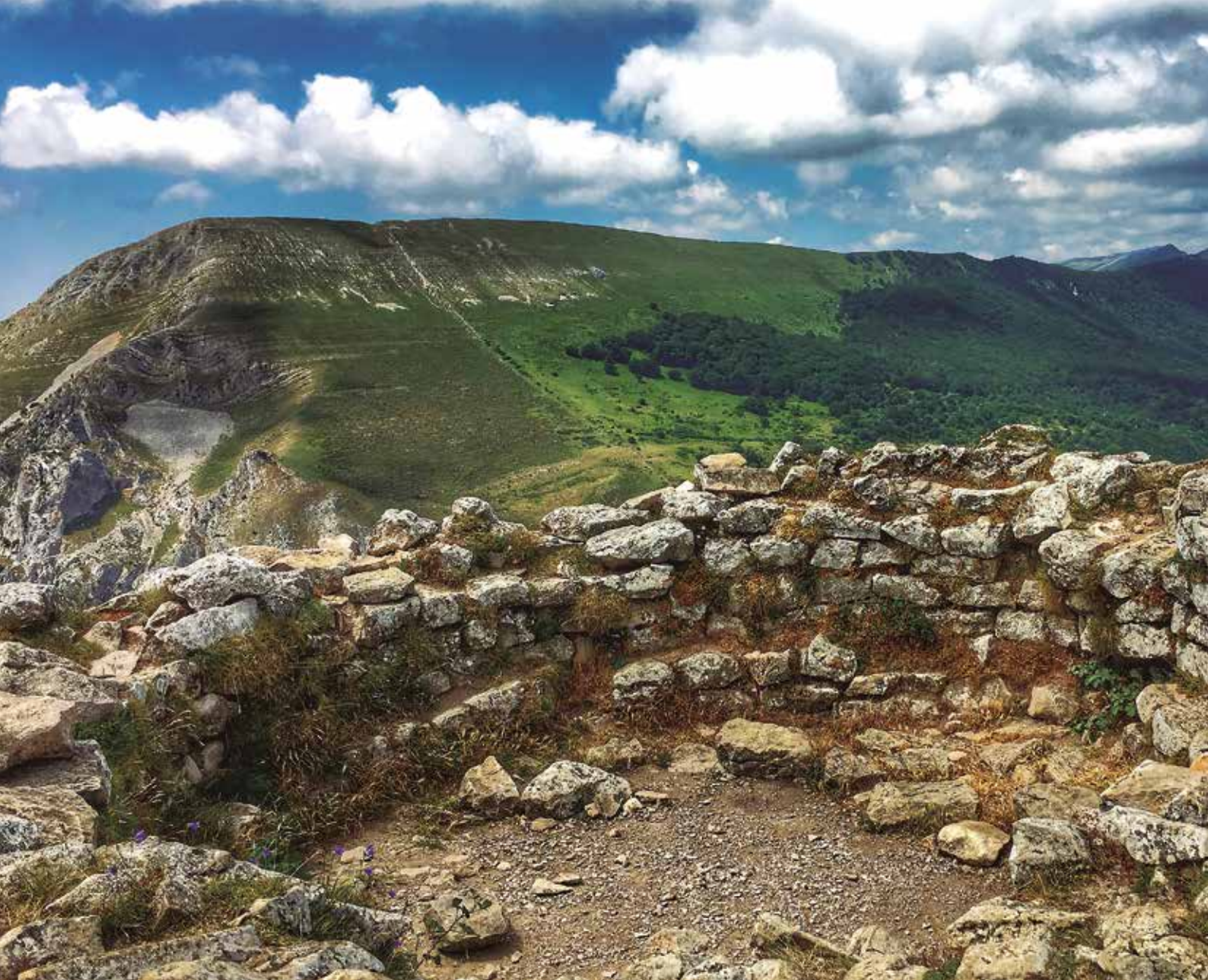
Gazteluko tontorrean Nafar Erresumaren Orarregiko gazteluaren aurriak

gure ezkerrera utzi eta pista zabalak berehala gerturatuko gaitu Txurregiko piramidearen beheko aldera. Bere magalean zehar hedatzen den bidetik erraz igoko dugu Gaztelu alderako aldapa. Bideak ekialderantz biratu eta ezkerrera ateratzen den bidea utzita diagonalean jarraituko dugu tontorretik gertu dagoen zabaldi txiki batera iristeko. Xenda nabarmen batek tontorrera igotzen lagunduko digu.