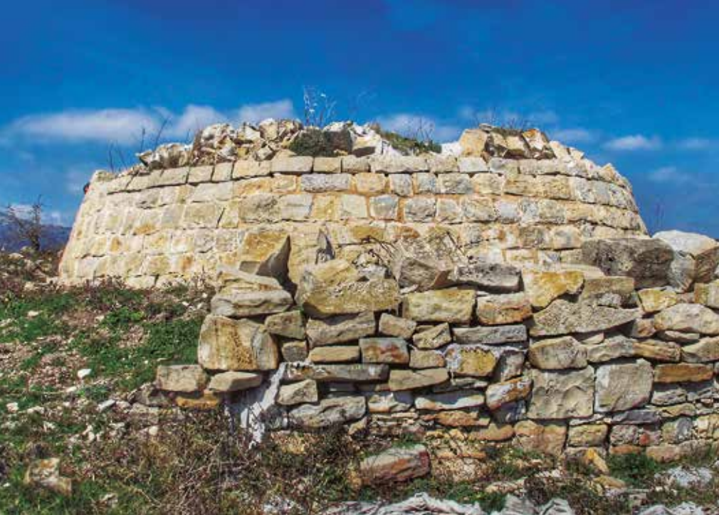
Garañoko gazteluaren hondarrak

tuko dugu zintzuraren hondoraino heltzeko, ur-jauzi ederraren azpira hain zuzen ere. Paraje ederra bezain ikusgarria. Zintzur honek duen edertasunak, makina bat sakan-jaitsiera zale erakartzen du eta bere neurrian bada ere, Guara edota Pirinioetan aurkitu daitezkeen ur-jauziekiko antzekotasun handia du. Ondo