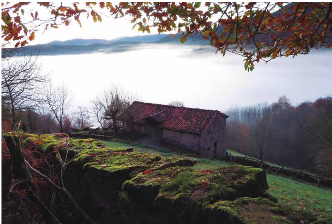
La niebla se estanca en el fondo del valle

Llevo el track en el GPS, aunque el camino está indicado. Bastaría con seguir las indicaciones de GR o las amarillas y blancas del PR NA-104 que sube hasta el collado de Bustiz o Bustizlepo por la subida normal del embalse. Salimos del pueblo y vemos un panel indicador, seguimos ascendiendo y como referencia podemos tomar el paso bajo la tubería de agua que baja de Sagartxarko presa.