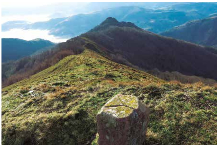
Mugarri en primer término y cima de Oltzorrotz