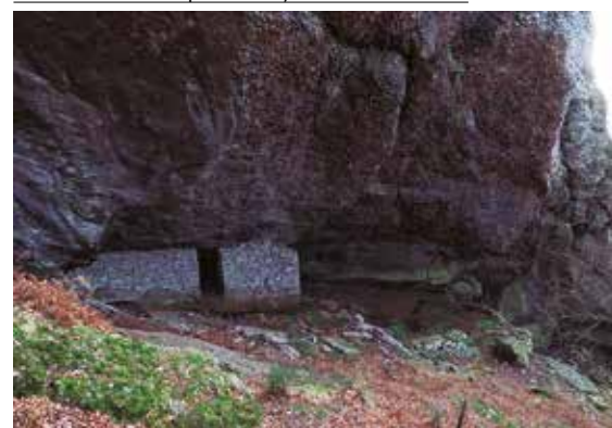
Borda de pastores bajo la falda del Mendaur

Y tras avanzar entre la maleza a lo Indiana Jones y tirar de GPS constantemente, consigo llegar a la civilización, o lo que es lo mismo, a una pista forestal, y ahí ya todo se vuelve fácil y cómodo. Se ve el pueblo, sé que solo es bajar