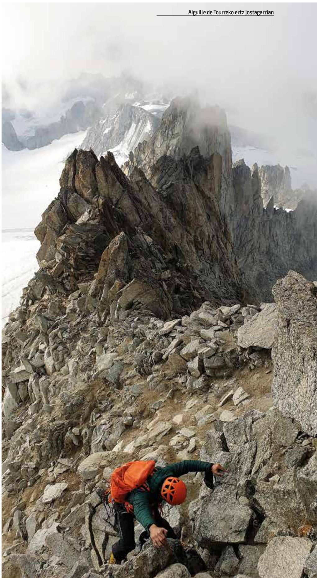
Aiguille de Tourreko ertz jostagarrian

Orain deshidratazio apur batekin, baina lan txukunaren pozak ematen duen indar pitin horrek lagundurik, dendak jasotzen ari gara edateko urik kantineploretan ez dugula. Zorte pixka batekin, Aiguille du Midiko azken teleferikoa hartuko dugu, zelairen batean botako gara lotara eta bihar gaua heldu orduko Portu Zaharreko txosnetan egongo gara gure Himalaian egindako abentura honengatik topa eginez!