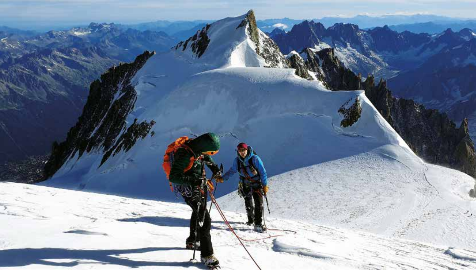
Mur de la Côte gaindituta, mendizaleok akituta

dean kabina. A zer nolako harrera egiten dion bisitariari inguruak 3800 metroan, mendizalea mututzeraino. Alpeetan beharrean, Oinak Izarretan bideo sorta xarmagarrian ikusten genituen mendi himalaitikoetan gaudela uste dugu. Estaziotik irtetzean, ertza gainditu eta berehala iritsi gara dendak dauden lekuetara, justuki Cosmiques aterpe azpian. Gure hasierako plana bi gau bertan igarotzea bazen ere, errealitatea oso desberdina da. Izan ere, ordu gutxi barru lo-zakutik atera eta Taculerako bidea hartu beharko dugu. Kanpin dendak jarri, afaria prestatu eta lo-zakuetan sartu gara nerbioek eta biharko igoerek logura urrunduz.