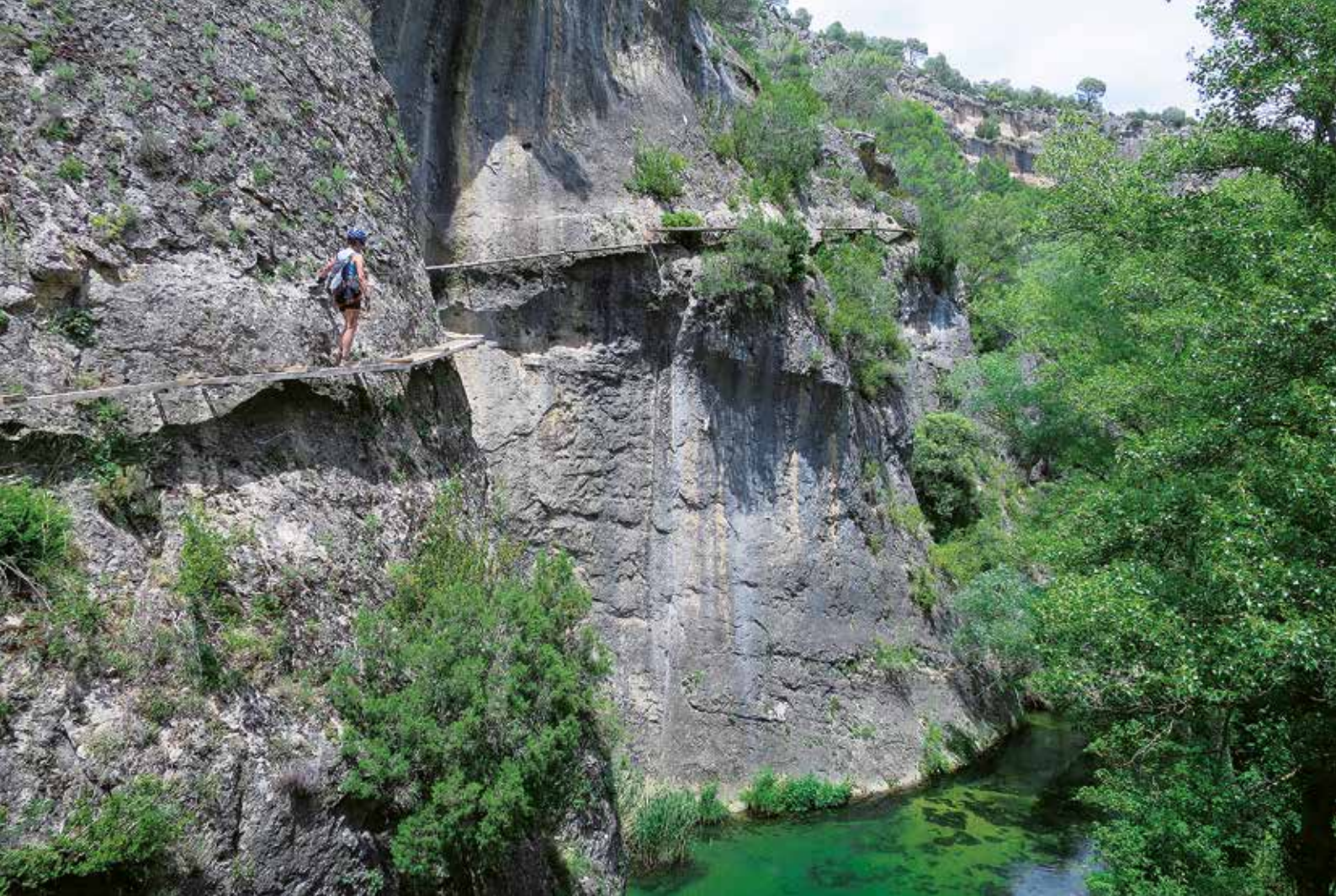
Estrechadas pasarelas de madera sobre el río Escabas (Hoz de Priego)