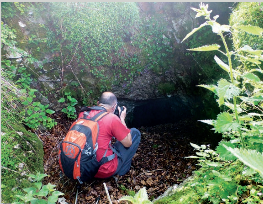
Primera bocamina, entrada cubierta de hojas

DE ERREZIL AL GAZUME POR LAS MINAS DE ZINC DE AZULEGI